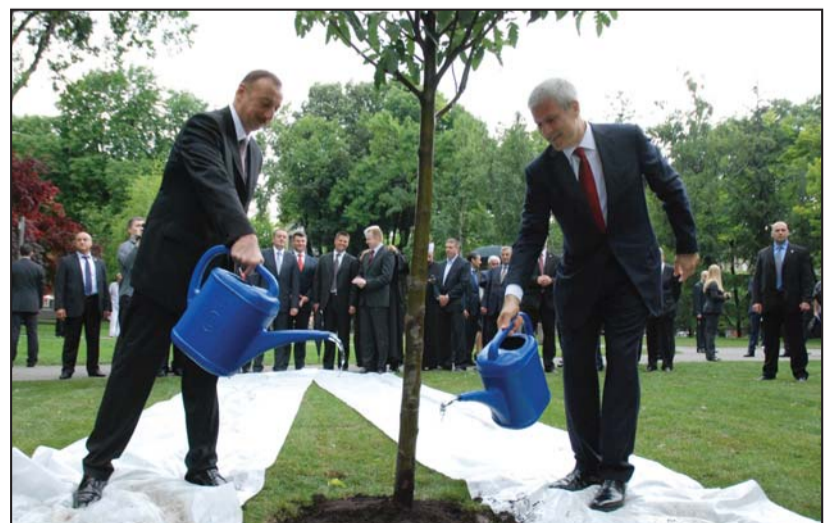
Tašmajdanski park obnovljen sredstvima Vlade Azerbejdžana: Predsednici Alijev i Tadić kraj drveta prijateljstva

Bilateralnu ekonomsku saradnju Srbije i Azerbejdžana karakteriše, prema oceni Privredne komore Srbije, mali obim robne razmene, uz konstantan rast izvoza iz Srbije. Tokom 2010. je izvoz iz Srbije u Azerbejdžan vredio 5,74 miliona dolara, a uvoz 735.000. U prva dva meseca 2011. izvoz je izneo 514.000, a uvoz 112.000 dolara. Kao perspektivne oblasti privredne razmene dve zemlje navedeni su poljoprivredno prehrambeni sektor, lekovi i medicinska opre-