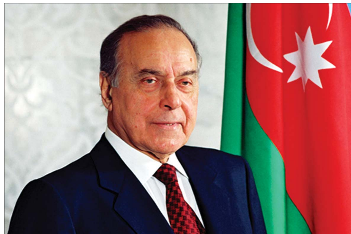
Stabilnost i ekonomski razvoj odredio kao prioritete: Heydar Alijev, nekadašnji predsednik Azerbejdžana