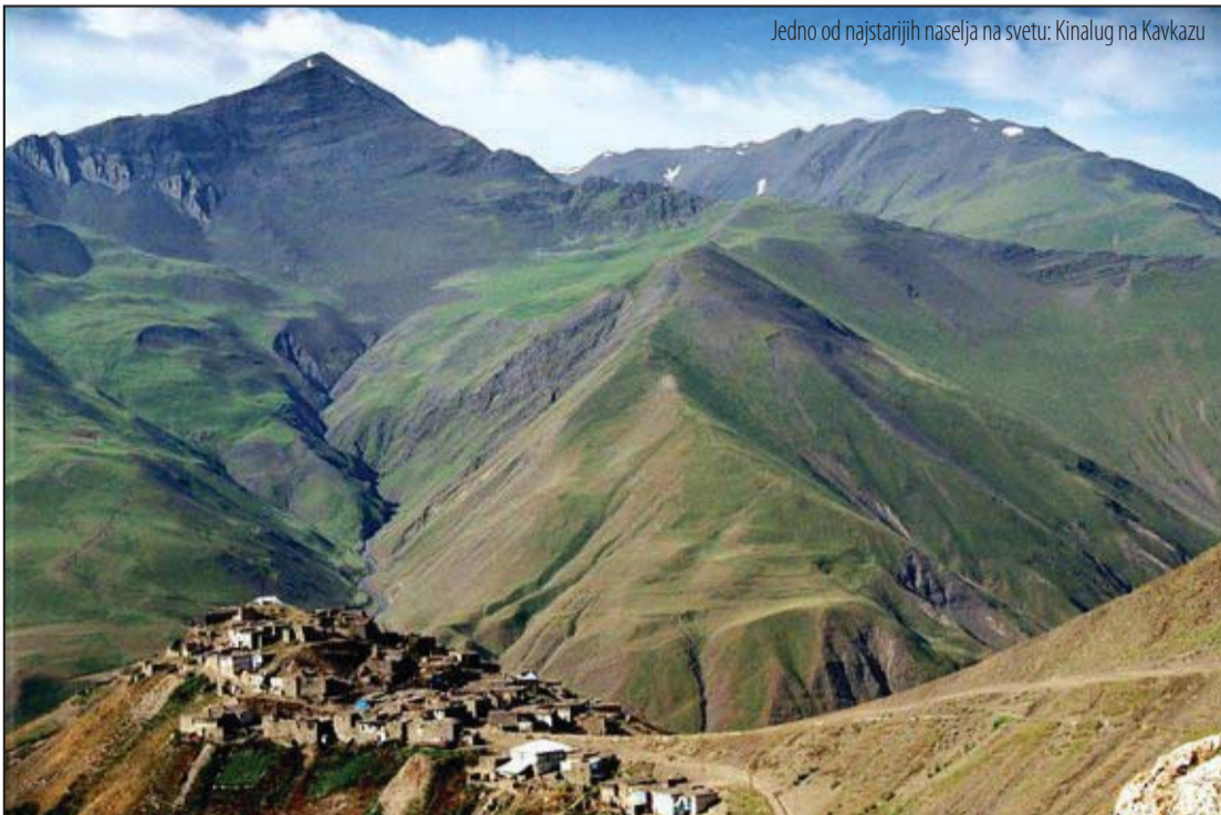
Jedno od najstarijih naselja na svetu: Kinalug na Kavkazu