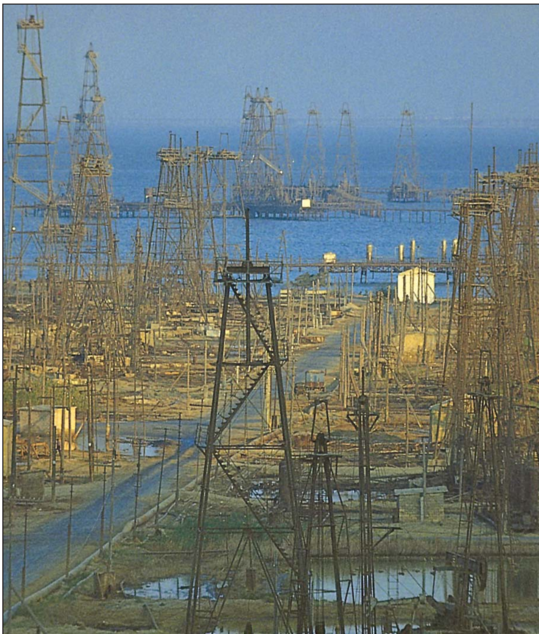
Modernizacija i razvoj osnovni ekonomski ciljevi: Baku, grad i naftne bušotine