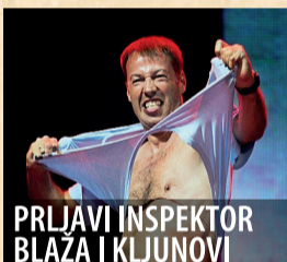
PRLJAVI INSPEKTOR BLAZA I KLJUNOVI