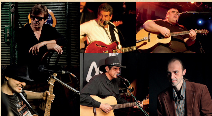
blues factory BELGRADE BLUES FACTORY