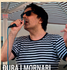
ĐURA I MORNARI