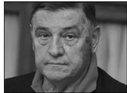
Milutin Mrkonjić, ministar za saobraćaj