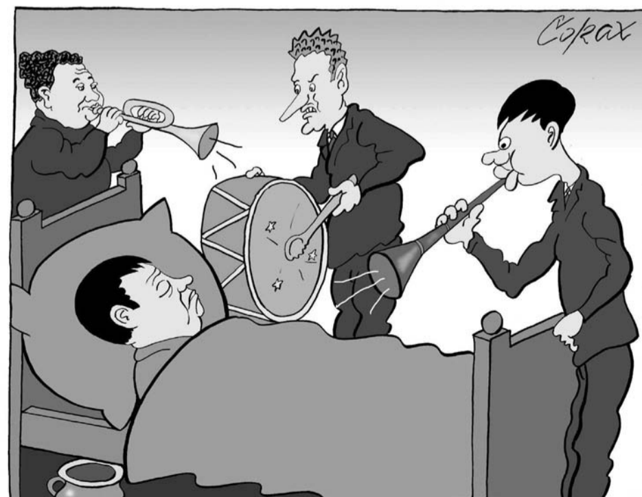
27. avgust. 2010.