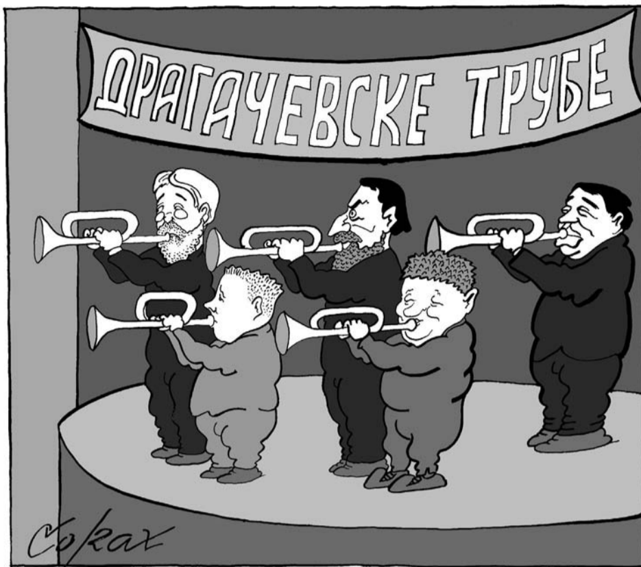
9. avgust. 2004.

Guča je srpski brend u svetu, a truba je instrument broj jedan. O značaju Sabora trubača dovoljno govori podatak da ga posećuje pola miliona ljudi, a da ih je većina iz inostranstva. Kvalitet potvrđuje i veliki broj inostranih orkestara. U Guču idem redovno i uvek se dobro provedem. Festival je iz godine u godinu sve bolji. Organizacija je odlična, a ja sam pomagao kad god sam bio u prilici. Saobraćajna infrastruktura je poboljšana, a narednih godina biće još bolja. To mogu da vam obećam. K.Ž.