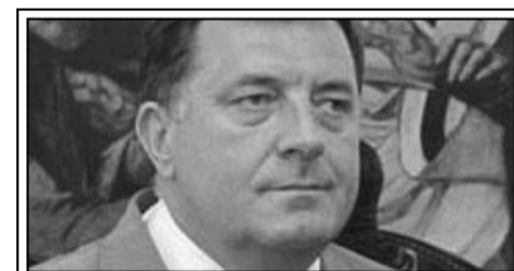
Milorad Dodik, predsednik Republike Srpske