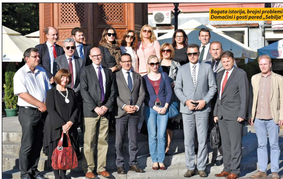
Bogata istorija, brojni problemi: Domaćini i gosti pored „Sebilja“