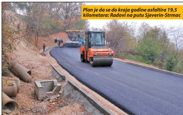
Plan je da se do kraja godine asfaltira 19,5 kilometara: Radovi na putu Sjeverin-Strmac

Počelo obeležavanje 20. novembra, Dana Sandžaka