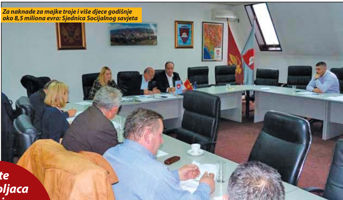
Plate Bjelopoljaca zaostaju za prosječnim zaradama u Crnoj Gori 18,13 odsto

Za naknade za majke troje i više djece godišnje oko 8,5 miliona evra: Sjednica Socijalnog savjeta