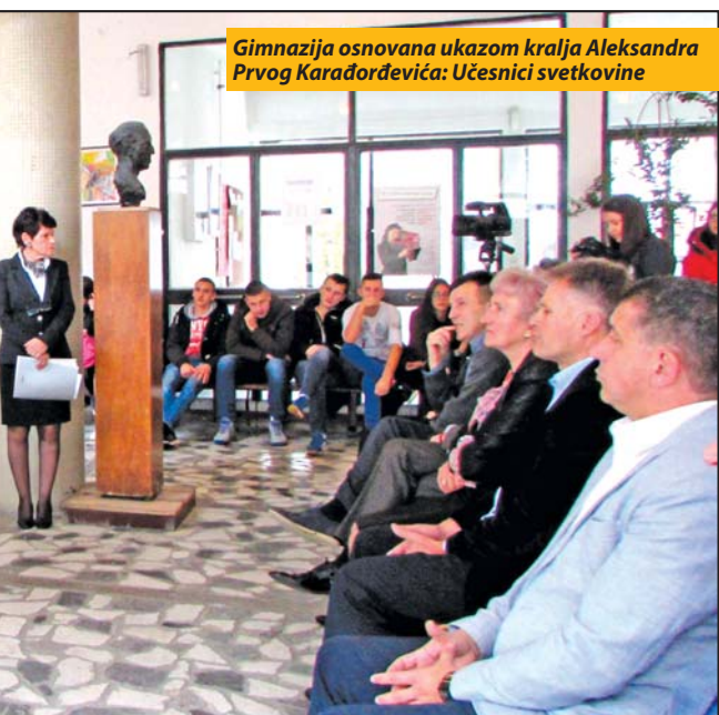
Gimnazija osnovana ukazom kralja Aleksandra Prvog Karađorđevića: Učesnici svetkovine

tog perioda, pokrenula lavinu sećanja na neka srećnija vremena, kada su se, kako je istakla, učitelj, pop i lekar mnogo više poštovali nego danas. - Sve se menja, došla su neka nova vremena, neke nove generacije na kojima svet ostaje, a ja ne mogu reći da su ovo Prustove reminiscencije „U potrazi za izgubljenim vremenom“ jer su ovo, ipak, voljna sećanja nakon 37 godina - istakla je profesorka francuskog, završivši svoju besedu latinskom izrekom „O tempora, o mores“ (Čudnih li vremena, čudnih li običaja).