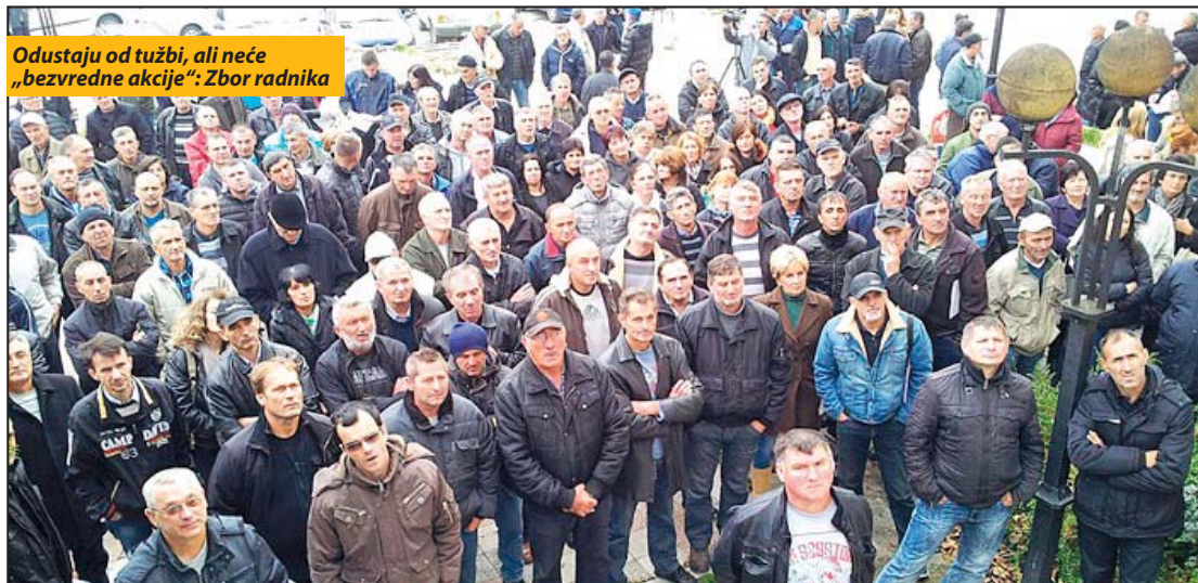
Odustaju od tužbi, ali neće „bezzredne akcije“: Zbor radnika

U sredu je održana, 9. sednica Opštinskog veća Priboja na kojoj je doneta odluka o o davanju saglasnosti da se potraživanja lokalne samouprave konvertuju u udeo opštine u kapital subjekta privatizacije Korporacije FAP a.d. Priboj.