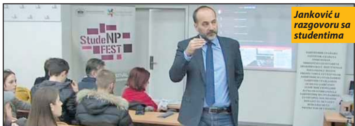
Janković u razgovoru sa studentima

Novi Pazar - Dodeljivanjem nagrada, večeras se završava Treći studentski festival „StudeNP fest“. U minulih pet dana studenti sa svih studijskih programa Državnog univerziteta kroz različite aktivnosti predstavili su svoja interesovanja. Na posebnim izložbama svoje radove predstavili su studenti arhitekture, građevine i likovne umetnosti, a svoja znanja i veštine predstavili su studenti hemije, poljoprivredne proizvodnje i prehrambene tehnologije i biologije. Studenti sa filoloških nauka kolegama su se predstavili na književnoj večeri. U okviru manifestacije na ovoj visokoškolskoj ustanovi održana je tribina pod nazivom „Prava građana u Srbiji - na papiru i u stvarnosti“. O ovoj temi govorio je Saša Janković, zaštitnik građana Srbije.