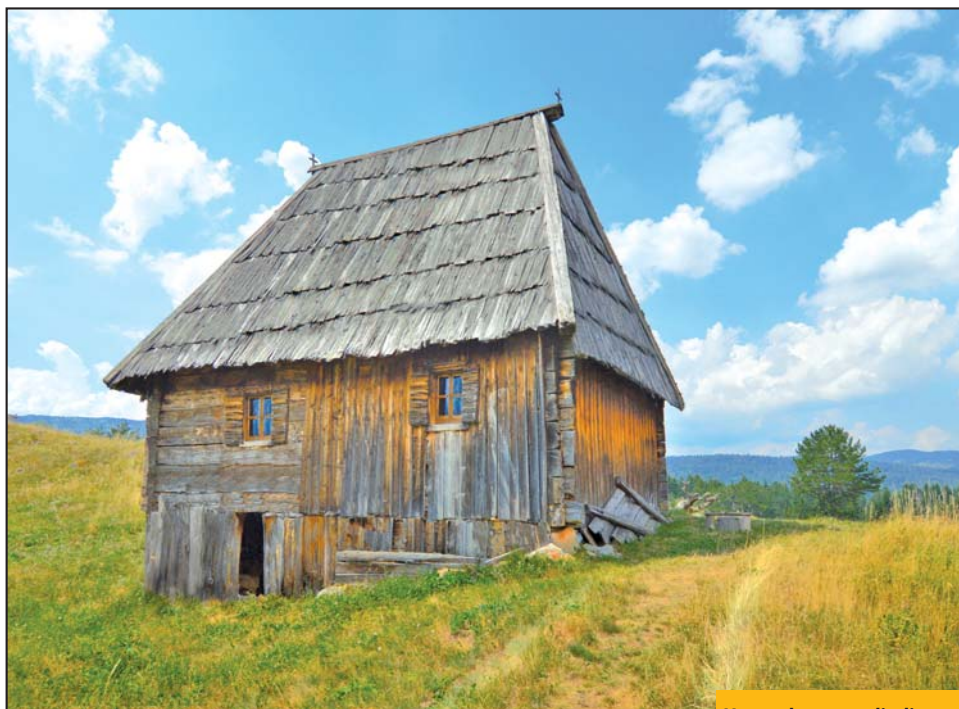
U narodnom graditeljstvu nije bilo promašaja: Stara seoska kuća

Na izložbi su kroz 33 fotografije predstavljeni primjeri tradicionalnog seoskog graditeljstva u pljevaljskom kraju, nastale u toku prošle godine. Vaso Knežević, autor izložbe, kaže da je sličnost arhitekture i graditeljstva pljevaljskog i prijevoljskog kraja izuzetno velika, ali da je sada prava rijetkost naći majstora koji bi samo od drveta, blata i kamena mogao izgraditi kuću. Otvarajući izložbu etnološkinja prijevoljskog muzeja Mi-