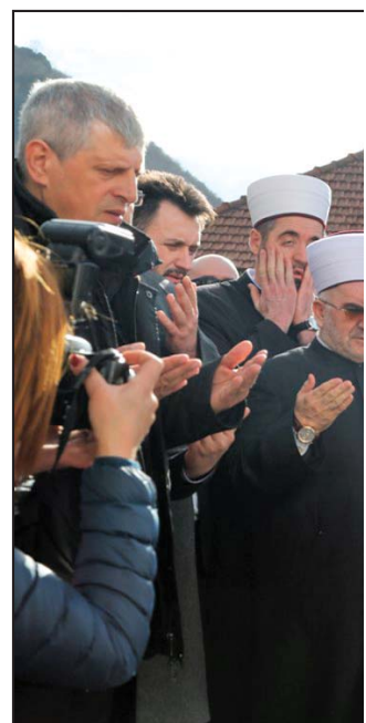
Prvi put zajedno: Opštinsko rukovodstvo organizatori i učesnici komemoracije bez mezarja pred spomenikom u P

Obraćajući se ispred prijevoljskog rukovodstva porodicama žrtava i brojnim okupljenim gra-