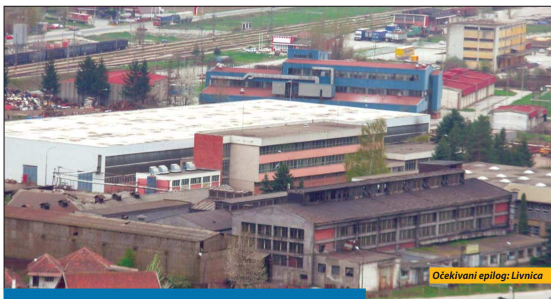
Očekivani epilog: Livnica

Upitan da li je ovo kraj „Livnice“ ili ima nade ukoliko se pojavi kupac koji bi bio zainteresovan za proizvodnju, Ružić odgovara da je Ministarstvo za