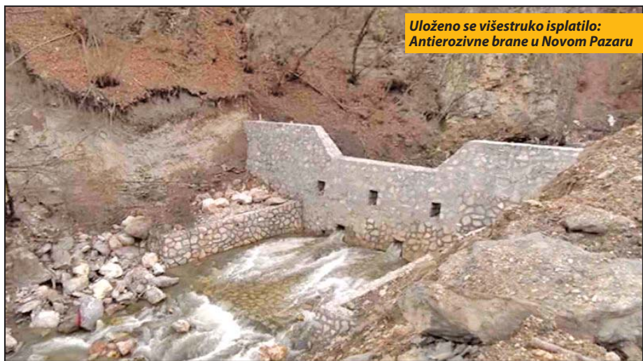
Uloženo se višestruko isplatilo: Antierozivne brane u Novom Pazaru

Predsednik BNV je zaključio da „na taj način državni organi Srbije mogu da skinu teret odgovornosti sa svih budućih generacija srpskog naroda za zločine nad Bošnjacima koji su počinjeni u njihovo ime“. Ugljanin smatra da je to „najbolji način za vraćanje međunacionalnog poverenja između Srba i Bošnjaka i uspostavljanja pravnog i trajnog mira na Balkanu“. Naglasio je da očekuje od SAD i EU da podrže ovaj stav „i omogućue uspostavljanje pravednog mira na Balkanu“. S.N.