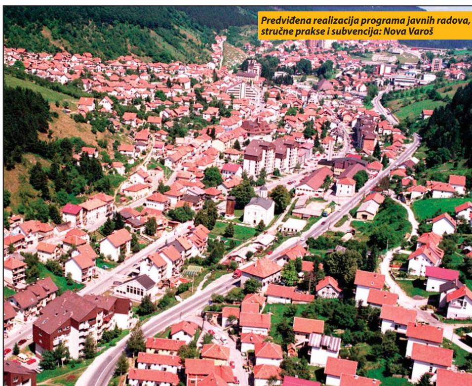
Predviđena realizacija programa javnih radova, stručne prakse i subvencija: Nova Varoš

Opština Nova Varoš je na polju zapošljavanja i otvaranja novih radnih mesta u periodu od 2009. do kraja 2016. uložila blizu 123.000.000 dinara. S tim budže-