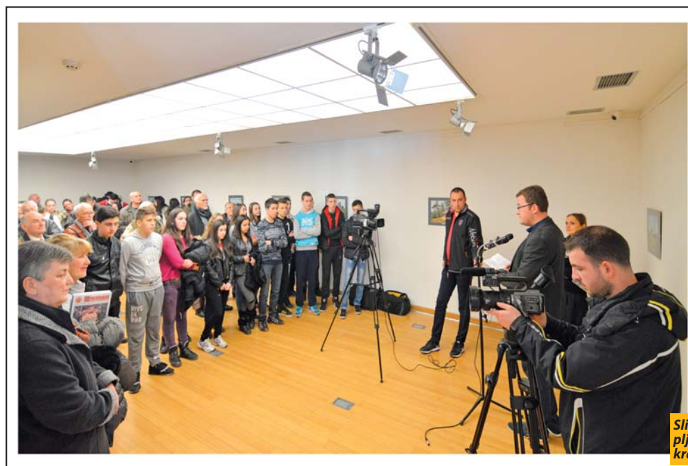
Sličnost seoskog graditeljstva pljevaljskog i prijevoljskog kraja: Sa izložbe