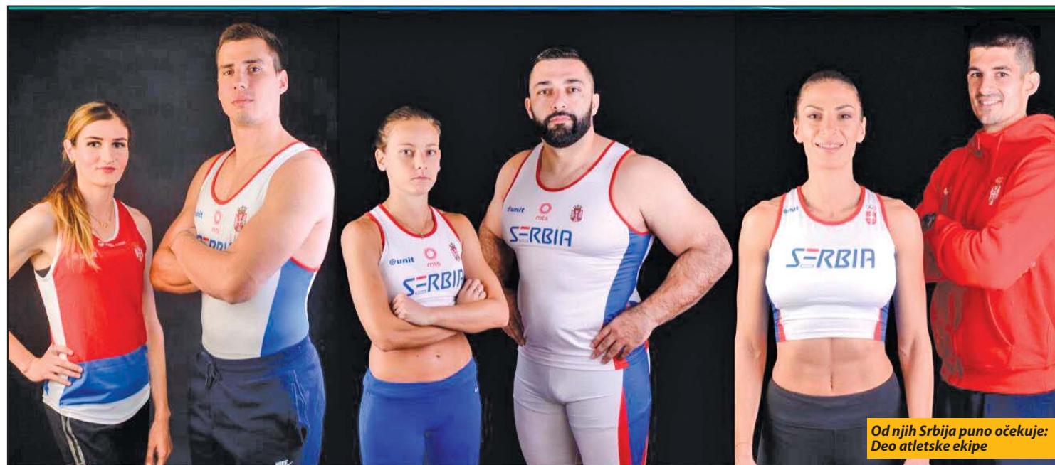
Od njih Srbija puno očekuje: Deo atletske ekipe