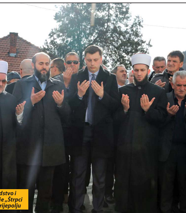
dstvo i ie „Štrpci rijepolju

Članovi porodica ne gube nadu da će ovaj zločin biti pravedno procesuiran, ali ne kriju nezadovoljstvo što se ništa ne čini u pogledu priznavanja statusa ubijenih putnika. Ovo pitanje za sobom povlači niz životnih, pa i egzistencijalnih problema sa kojima se suočavaju. I ove godine iz budžeta si izdvojena skromna novčana sredstva je na ime pomoći porodicama ubijenih Prijepoljaca.