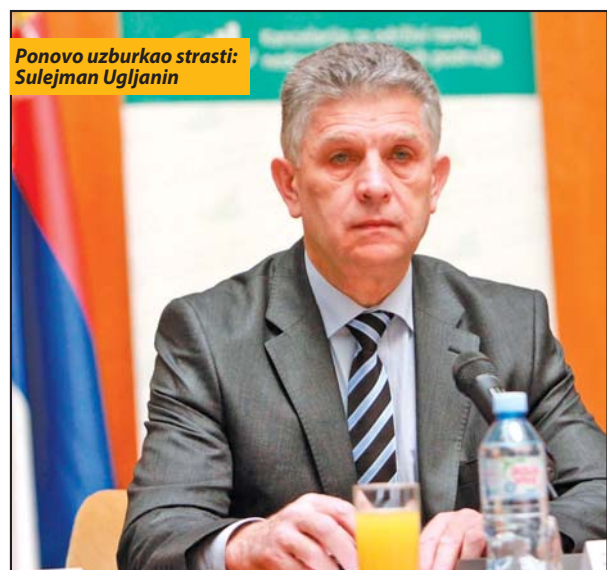
Ponovo uzburkao strasti: Sulejman Ugljanin