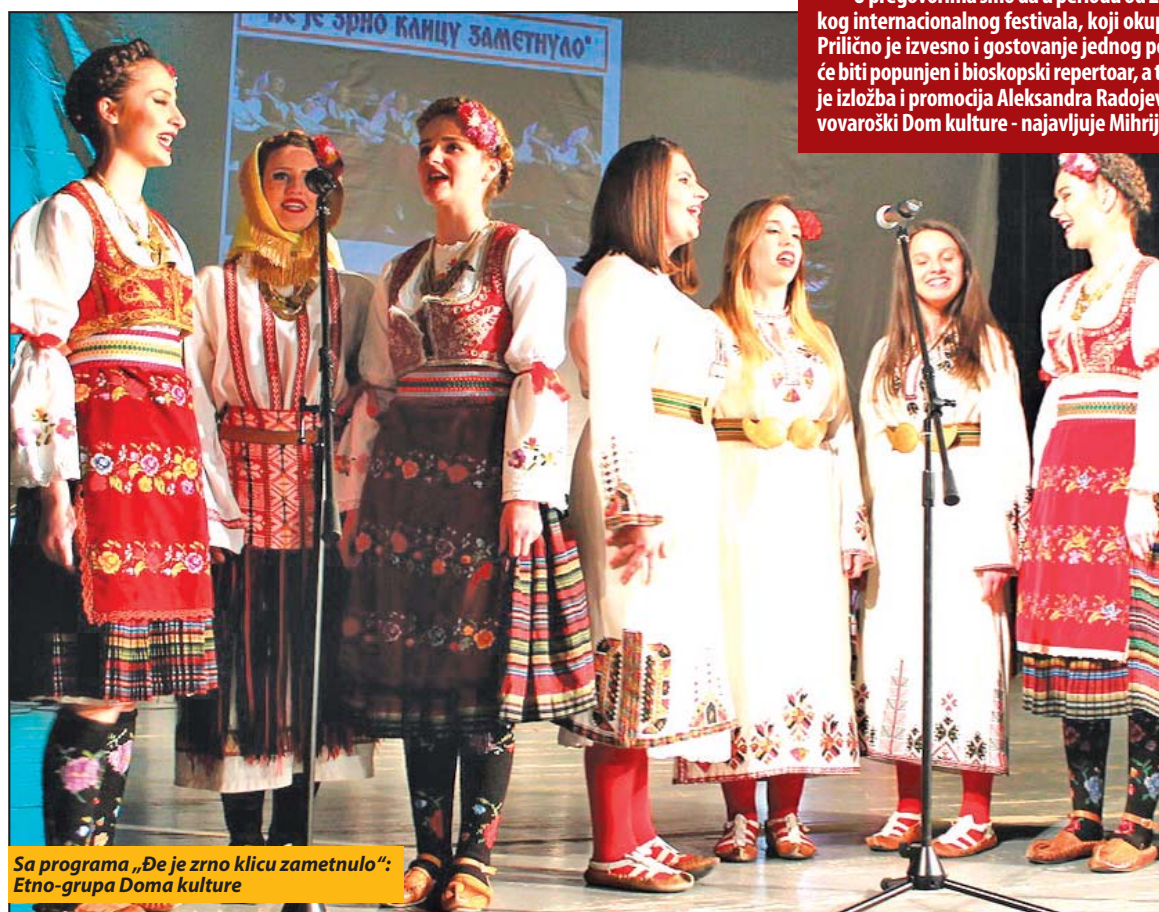
Sa programa „De je zrno klicu zametnulo“: Etno-grupa Doma kulture