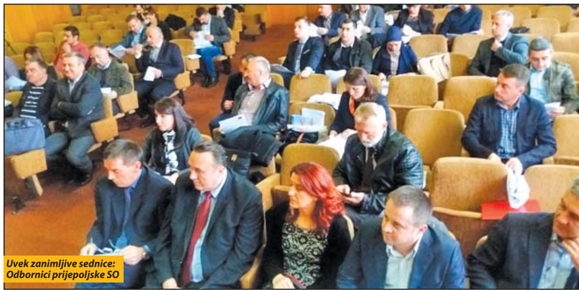
Uvek zanimljive sednice: Odbornici prijepoljske SO