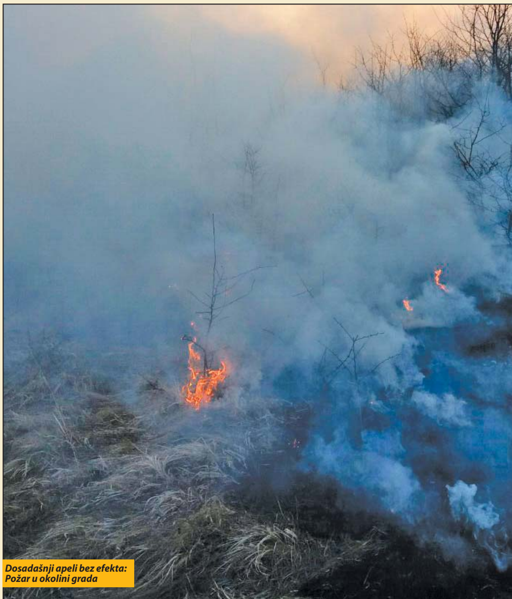
Dosadašnji apeli bez efekta: Požar u okolini grada

Goran Čavić, komandir Službe zaštite i spasavanja, ističe da ako se ova nastavi Služba neće moći udovoljiti svim pozivima, što može imati nesagledive posledice. „U posljednjih nekoliko dana mi smo gotovo 24 časa na terenu. Imali smo veliki broj požara, uglavnom na različitim pravcima