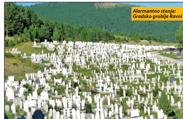
Alarmantno stanje: Gradsko groblje Ravni

- Očekujemo da se ovaj problem riješi u narednih mjesec dana. Opština se obratila zahtjevom Vladi da joj ustupi dio zemljišta sa sjeverne, bočne strane groblja, gdje se sahranjuju pripadnici muslimanske vjeroispovijesti. Od države je traženo da na Opštinu prenese dio zemljišta kako bi se groblje proširilo prema