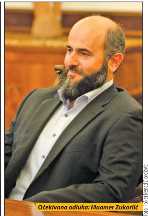
Očekivana odluka: Muamer Zukorlić