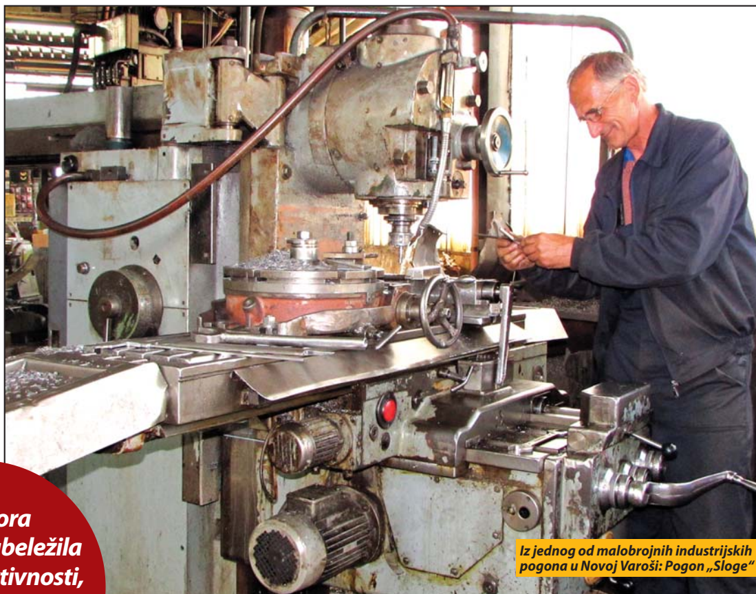
Iz jednog od malobrojnih industrijskih pogona u Novoj Varoši: Pogon „Sloge“

Sva tri sektora industrije zabeležila pojačane aktivnosti, ali zarade znatno niže od republičkog proseka