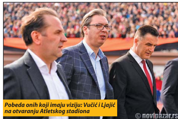
Pobjeda onih koji imaju viziju: Vučić i Ljajić na otvaranju Atletskog stadiona

Premijer i predsednički kandidat Vučić rekao je da zna da mu mnogi Bošnjaci nisu verovali ni pre godinu, ni pre dve godine, „ali siguran sam da ste