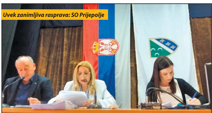
Uvek zanimljiva rasprava: SO Prijepolje

Prvo ovogodišnje zasjedanje Skupštine opštine Prijepolje