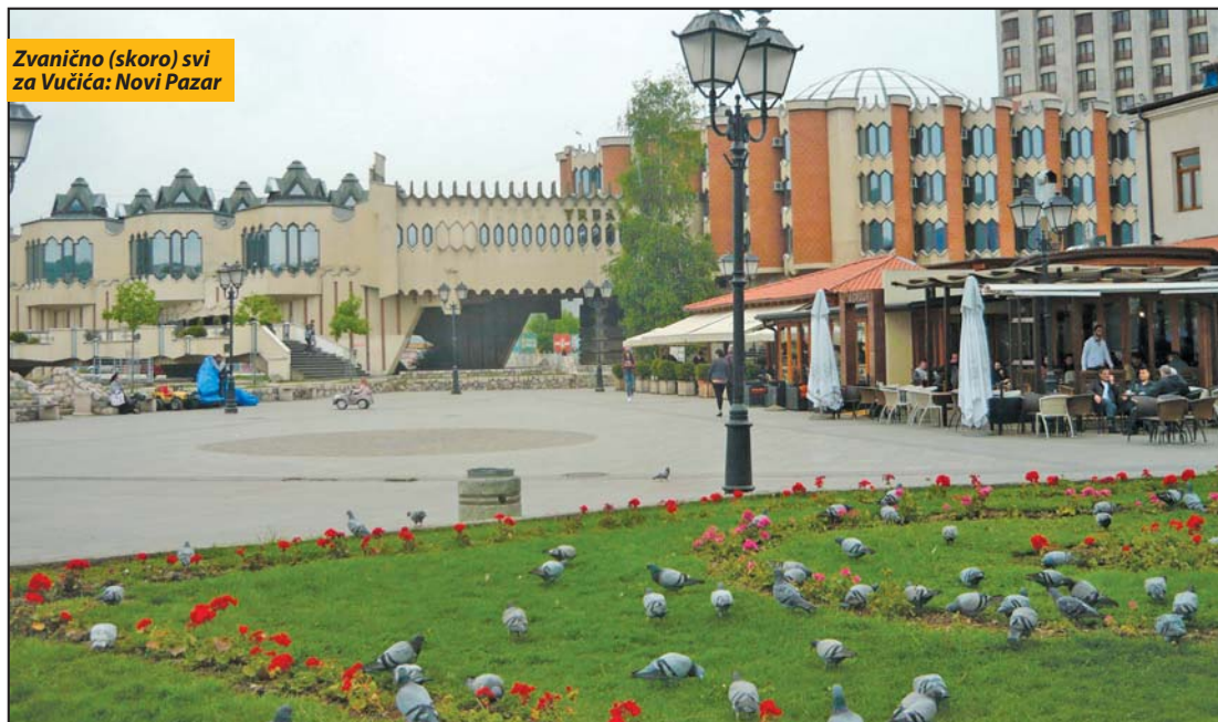
Zvanično (skoro) svi za Vučića: Novi Pazar

ostala je samo još SDA Sandžaka Sulejmana Ugljanina da se izjasni kojeg će predsedničkog kandidata da podrži. Ranije su to učinile SDPS i SDP Rasima Ljajića, Sandžacka narodna partija (SNP) Mirsada Đerleka i Bošnjačka