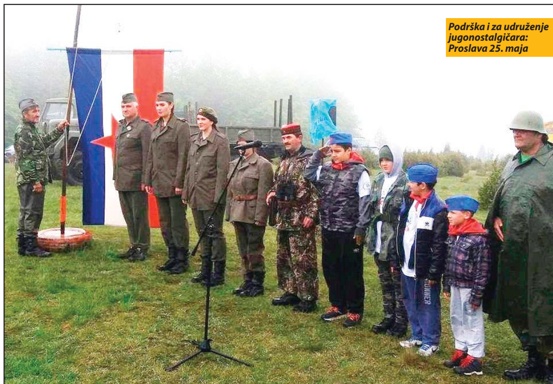
Podrška i za udruženje jugonostalgičara: Proslava 25. maja

Jele Cimbaljević. Za ovo krivično delo predviđena je zatvorska kazna do 12 godina. Optuženi su negirali krivicu, a suđenje je počelo 2015. Ostavke su zbog smrti beba u Bijelom Polju podneli tadašnji ministar zdravlja Miodrag Radunović i direktor bolnice optuženi Jeremić. Tahirović i Puletić su po izbijanju jedne od najvećih afera u zdravstvu Crne Gore, koja je pokazala brojne „ranjivosti“ sistema, smenjeni s dužnosti načelnika odeljenja najveće bolnice na severu zemlje. S.D.