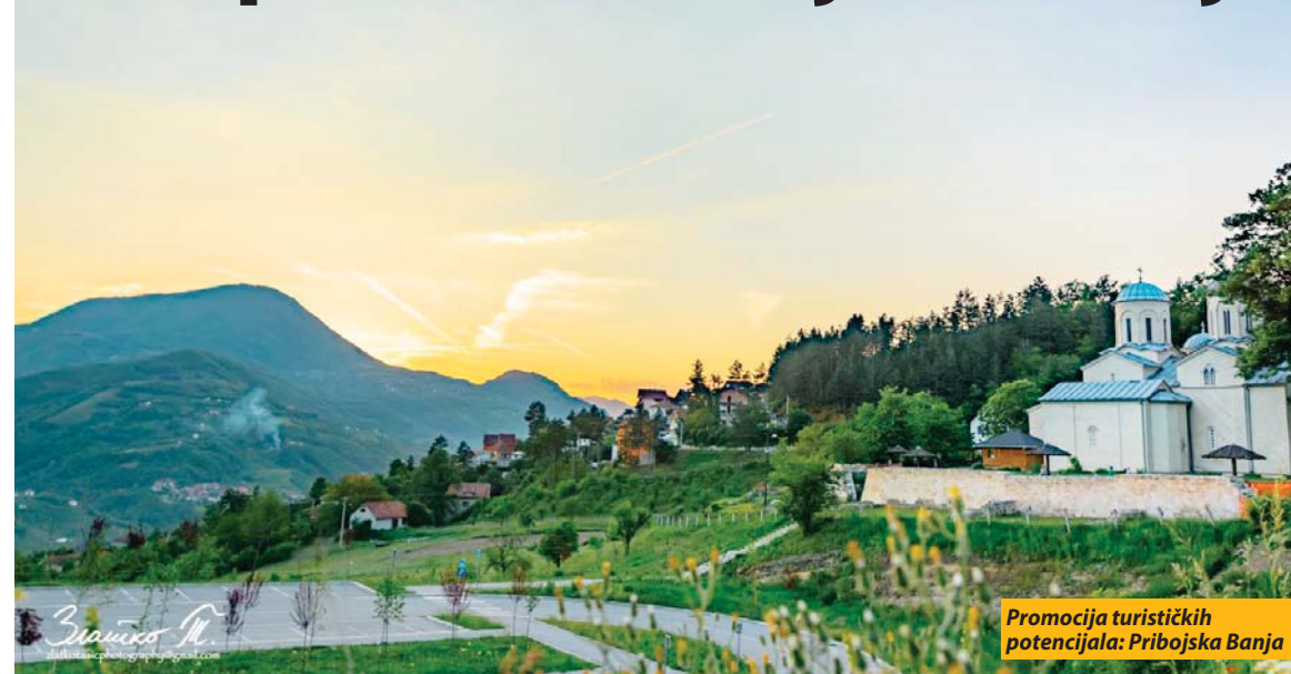
Promocija turističkih potencijala: Pribojska Banja

Priboj - Ovogodišnja manifestacija Dani planinara Srbije biće održana u Pribojskoj Banji, u organizaciji Železničkog kluba planinara „Ljeskovac“ iz Priboja, a pod pokroviteljstvom Planinarskog saveza Srbije i Opštine Priboj. Planinarski tabor, biće postavljen u prostoru Osnovne škole „Nikola Tesla“ u Pribojskoj Banji od 30. juna do 2. jula.