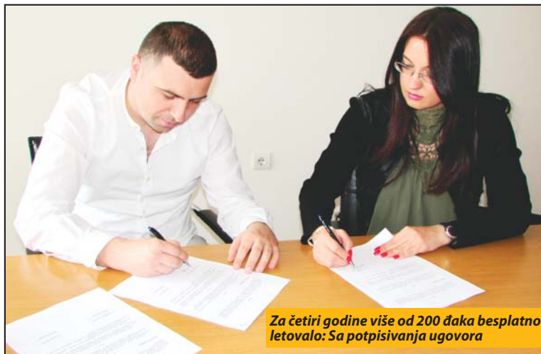
Za četiri godine više od 200 đaka besplatno letovalo: Sa potpisivanja ugovora

- Očekujemo da će deca iz Nove Varoši i okoline biti zadovoljna smeštajem koje je apartmanskog tipa, kao i ishranom, zdravstvenom negom i svim drugim pratećim sadržajima koji su im na raspolaganju u našem moderno opremljenom objektu na samoj obali mora. Cene usluga su pristupačne, a ugovorom smo lokalnoj upravi omogućili plaćanje na više mesečnih rata, istakao je Muškić prilikom nedavnog potpisivanja ugovora u prostorijama CSR. U Centru će, inače, u saradnji sa školama već ovih dana početi sa definisanjem spiskova potencijalnih kandidata za letovanje, a na osnovu prethodno done-