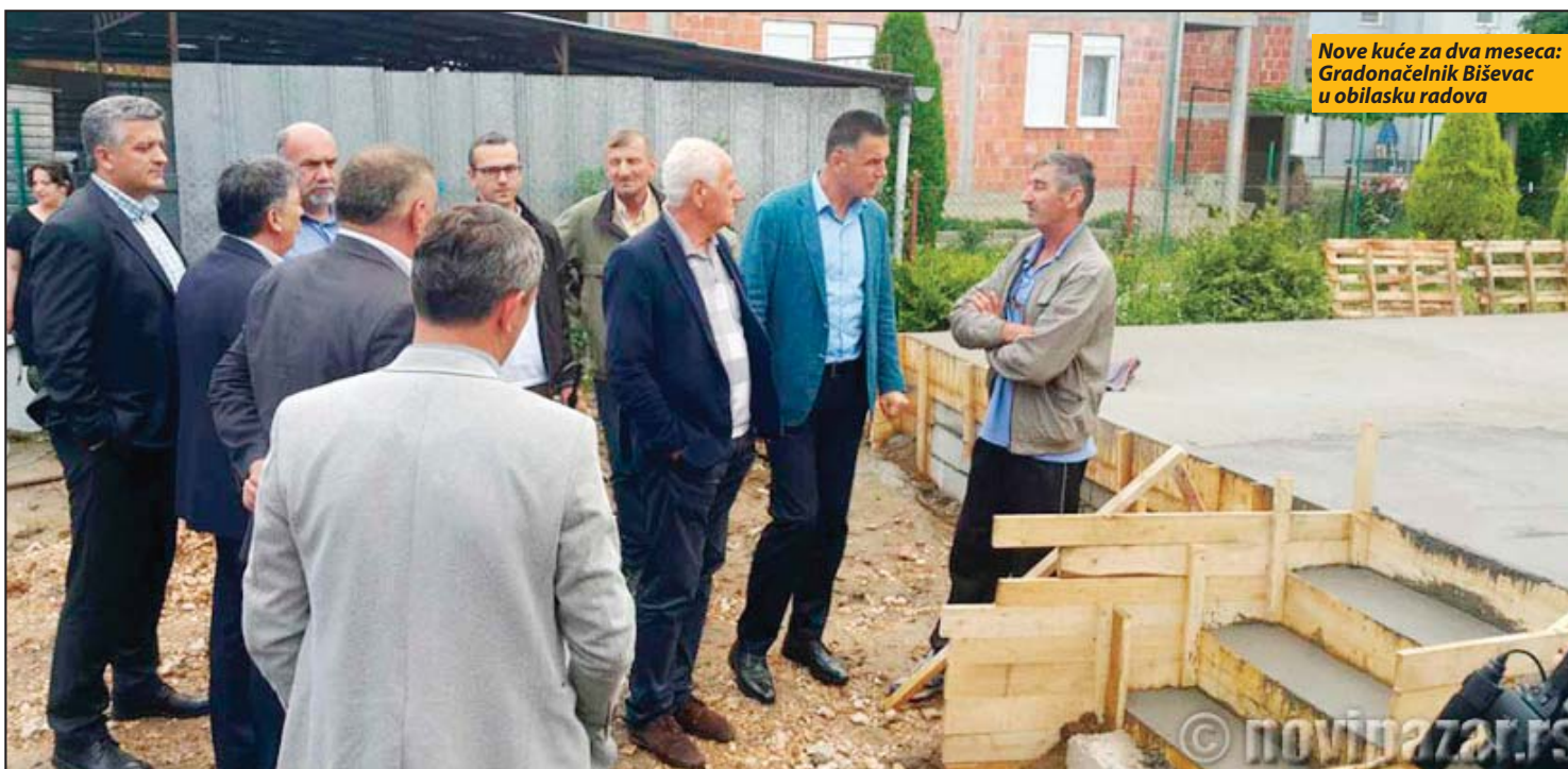
Nove kuće za dva meseca: Gradonačelnik Biševac u obilasku radova