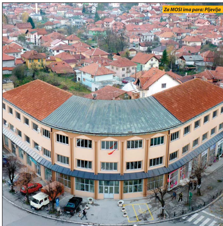
Za MOSI ima para: Pljevlja

- Dok se u Bijelom Polju već mjesecima rekonstruiše gradski trg, zaposleni u bjelopoljskoj Opštini ne primaju plate, ali im u isto vrijeme stižu tužbe za neplaćene komunalije, navodi se u saopštenju građanskog pokreta URA, koje potpisuje predsjednik bjelopoljskog odbora Hajro Bučan. „Uzimajući u obzir činjenicu da su sredstva za rekonstrukciju trga obezbijedena kroz donaciju kompanije 'Adriatic Properties' iz Budve, te da će samo prva faza radova koštati oko 900.000 evra, ostaje vrlo upitna neobična visina iznosa tih radova, ali i način obezbjeđivanja pomenute donacije, prilikom koje je 'premier posredovao'. Na koji način je kompaniju, koja nema bilo kakvih investicija u Bijelom Polju, premijer uspio da ubijedi da finansira rekonstrukciju trga - u navedenom iznosu? Sa druge i suštinske bitnije strane, dok se Bijelo Polje nalazi u socioekonomskoj vještačkoj komi, umjesto da lokalna uprava i Vlada preuzmu hitne i neophodne korake za sanaciju takvog stanja, oni „oboljelog pacijenta“ šminkaju uređenjem Trga. Koliko se samo radnih mjesta moglo obezbjeđiti, za tih 900.000 evra?!, upi-