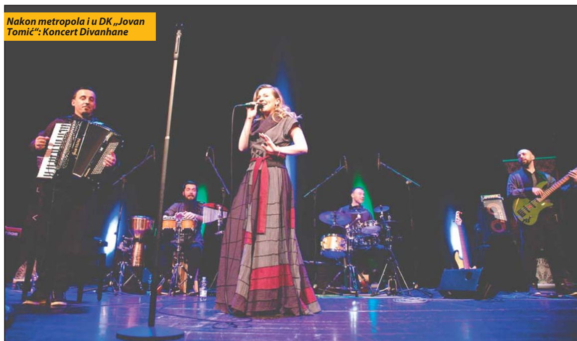
Nakon metropola i u DK „Jovan Tomić“: Koncert Divanhane

Koncert sarajevskog benda Divanhana u novovaroškom Domu kulture