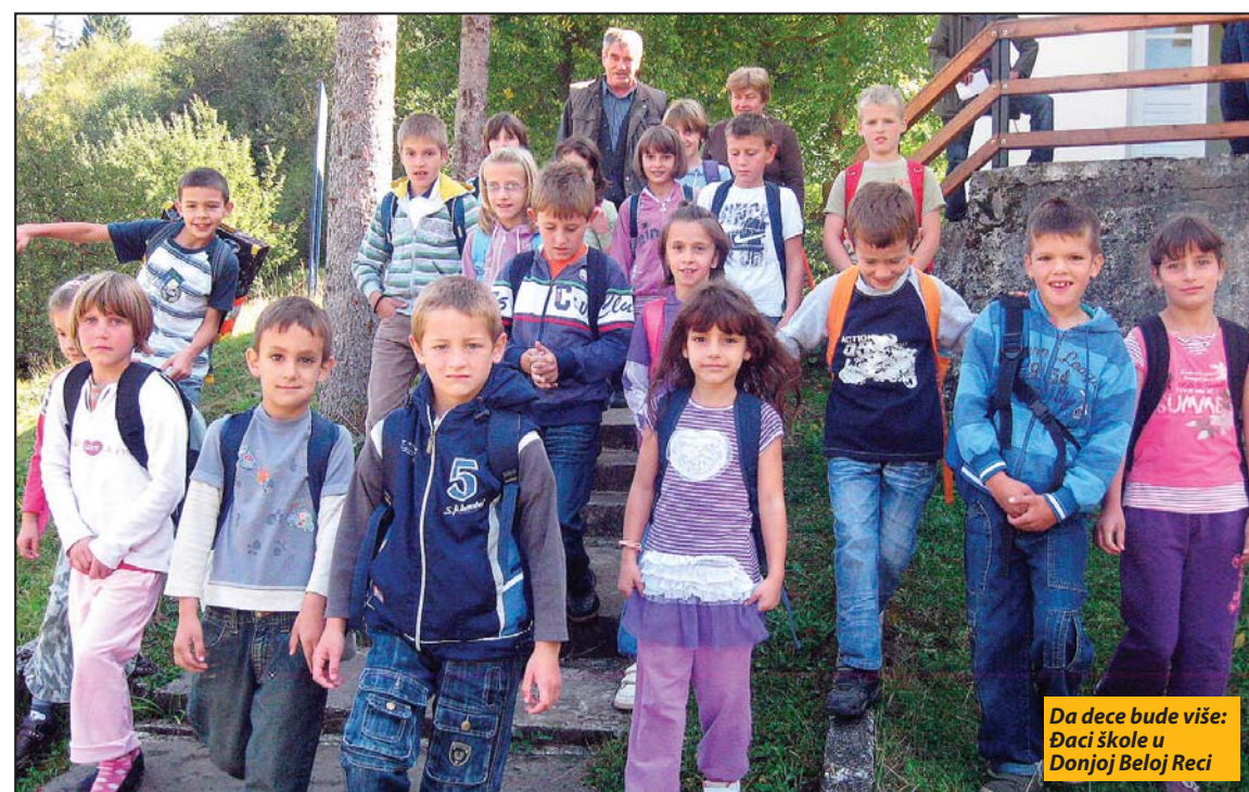
Da dece bude više: Daci škole u Donjoj Beloj Reci

Opština Nova Varoš u ovom zajedničkom programu države i lokalne samouprave učestvuje sa oko 2,8 miliona dinara. Sredstva od skoro 18.000.000 dinara biće utrošena na nekoliko mera značajnih za poboljšanje stanja u ovoj oblasti. U okviru mere za ublažavanje ekonomske cene podizanja deteta, oko 9,5 miliona dinara biće tokom ove godine isplaćeno na ime novčane naknade za novorođenčad, a 3.000.000 dinara za pomoć nezaposlenim porodičama. Za promociju reproduktivnog zdravlja adolescenta izdvojeno je