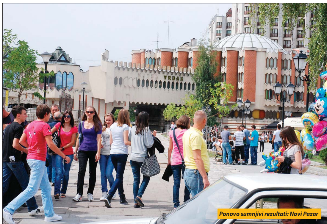
Ponovo sumnjivi rezultati: Novi Pazar