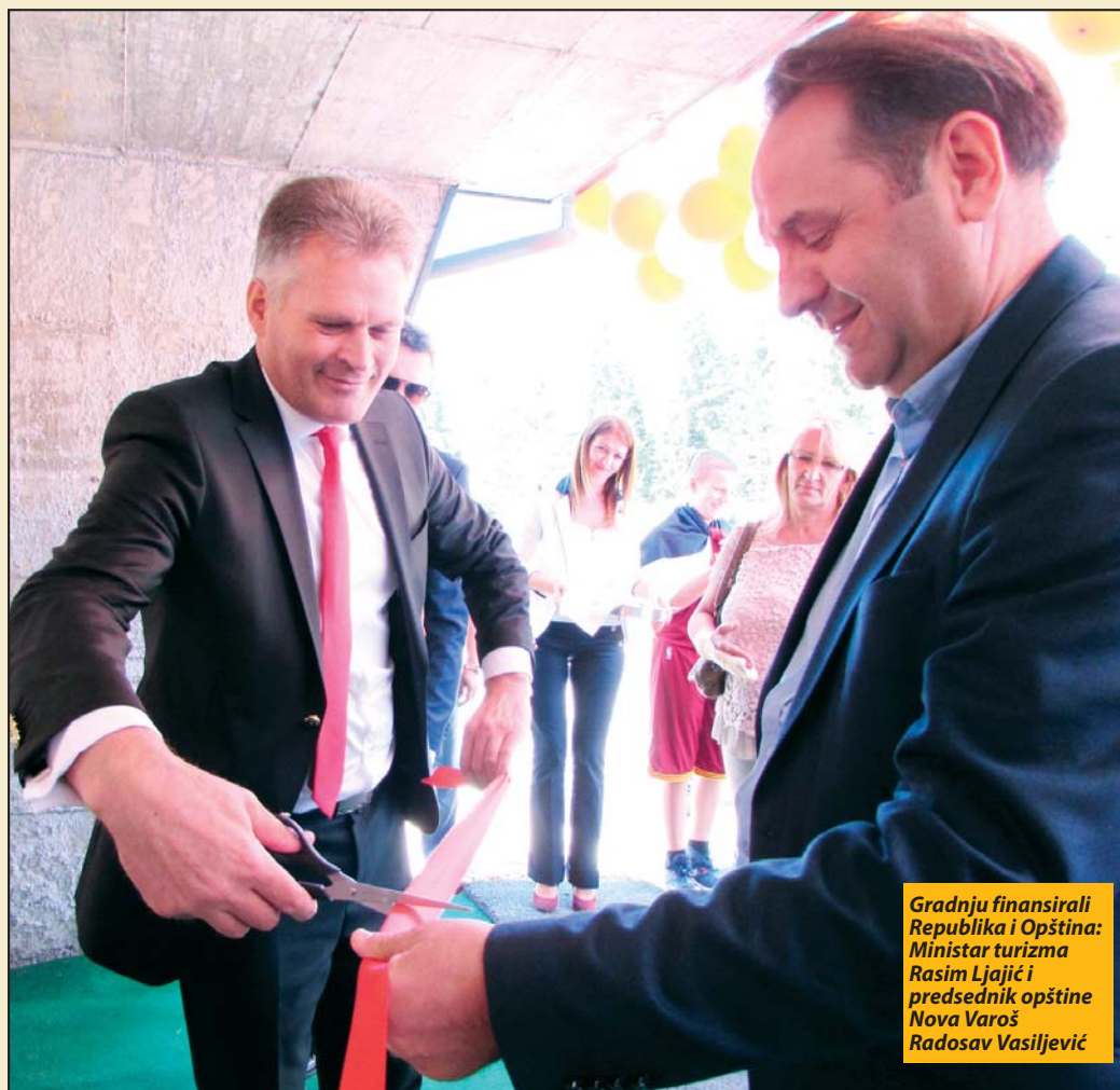
Gradnju finansirali Republika i Opština: Ministar turizma Rasim Ljajić i predsednik opštine Nova Varoš Radosav Vasiljević

- Razmatramo mogućnost investiranja u fudbalski teren na Zlataru, a dobre su i ideje vezane za izgradnju i uređenje pešačkih i biciklističkih staza. Bolja infrastruktura bi svakako trebalo da poveća turistički promet i broj gostiju i na ostvarenju tog cilja država i opština moraju zajednički raditi, istakao je ministar Rasim Ljajić uz ocenu da savremeni turista traži aktivan odmor. „Zato se lepeza turističkih sadržaja na Zlataru mora proširiti. U redu su prirodni resursi, ali se od potencijala očekuje stvaranje nove vrednosti odnosno profita kako bi se potom reinvestiralo u ovu oblast. Trebalo bi da najozbiljnije razmotrimo i šta bi ova planina odnosno opština mogli da ponude turistima