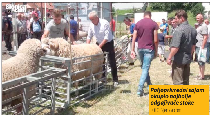
Poljoprivredni sajam okupio najbolje odgajivače stoke

Drugi dan bio je rezervisan za ocenjivanje kvaliteta priplodnih grla krupne stoke. I ovde su bile tri kategorije: junice, bikovi i krave. Stručni žiri je dodelio 10 nagrada, u svakoj kategoriji po tri i nagradu za šampiona ovogodišnjeg sajma. Od 19 nagrađenih uzgaji-