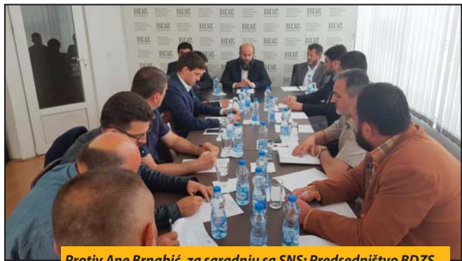
Protiv Ane Brnabić, za saradnju sa SNS: Predsedništvo BDZS

Zukorlić je u toku konsultacija sa predsednikom Srbije o izboru novog mandatar reкао da „ne bi bilo dobro da se na mestu mandatar nađe Ana Brnabić, koja bi zbog svoje seksualne orijentacije iritirala duhovna i etička uverenja apsolutne većine građana“. On, bez obzira na ovo „nerazumevanje“ sa SNS, očekuje da će u novom sazivu Vlade Srbije BDZS imati državne sekretare i da će „mladi bošnjački kadrovi imati priliku da iskažu svoje kvalitete u vladinim institucijama“. U prethodnom sazivu republičke vlade ova partija je imala dva predstavnika na mestima državnih