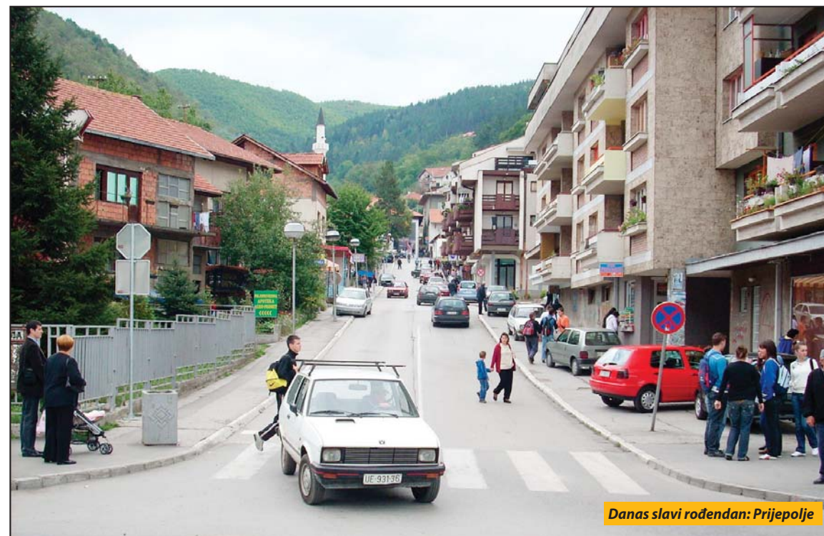
Danas slavi rođendan: Prijepolje

Kako izveštava portal PP media, pohvale na dostavljeni izveštaj o radu JKP „Lim“ iz Prijepolja na račun direktora stigle su i od pozicije i opozicije, međutim dve strane imale su različito viđenje stanja u kome se ovo preduzeće nalazi. Vladajuće stranke smatraju da je glavni problem u ovom preduzeću nedostatak stručnog kadra, te da dugovi koji se gomilaju mogu da ugroze normalno funkcionisanje ovog preduzeća i da treba očekivati njegovo restrukturiranje. Opozicija, međutim, smatra da izveštaj o radu daje jasnu sliku stanja u kome se ovo preduzeće nalazi. Sadašnja opozicija, a ranija vlast ističe da izveštaj pokazuje da se tokom njihovog mandata nije neplanski zapošljavalo, što im sadašnja vlast, a