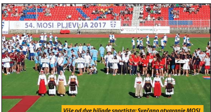
Više od dve hiljade sportista: Svečano otvaranje MOSI