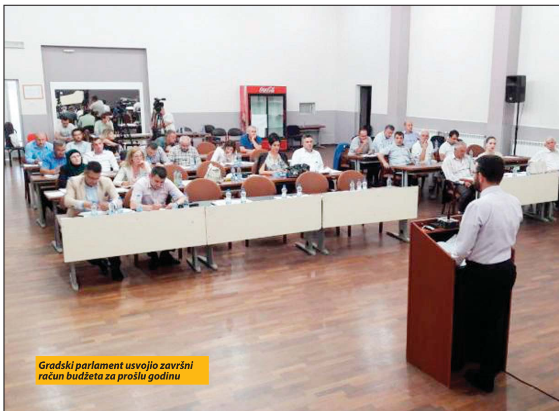
Gradski parlament usvojio završni račun budžeta za prošlu godinu