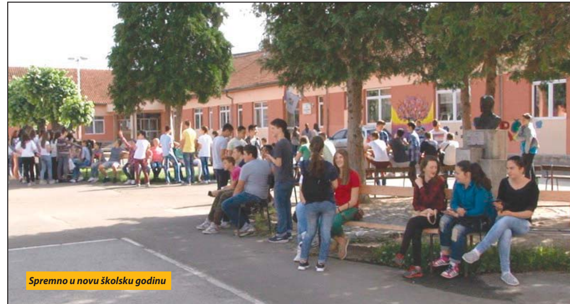
Spremno u novu školsku godinu