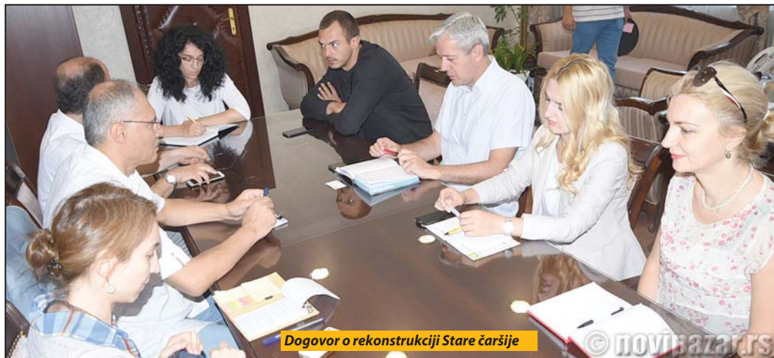
Dogovor o rekonstrukciji Stare čaršije

Novi Pazar - Konačno je na red došlo sređivanje kulturno-istorijskog nasleđa islamske kulture u Novom Pazaru. Dosta dugo je trajala priča o restauraciji Stare čaršije, hamama koji je izgradio osnivač ovog grada Isa-beg Isaković i Kule motrilje u gradskom parku.