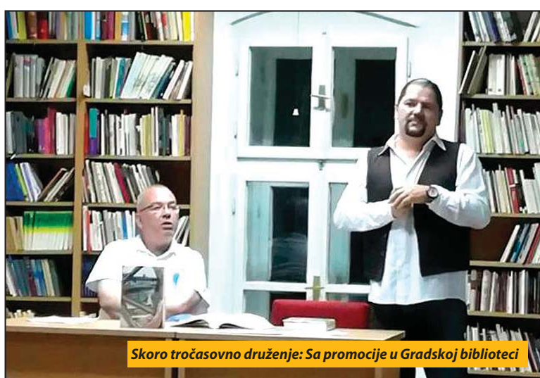
Skoro tročasovno druženje: Sa promocije u Gradskoj biblioteci

Delo je, po oceni kritike, pisano bez mitomanskog manira i kao takvo predstavlja monumentalnu „građevinu“ na 700 strana, sa bogatim kolor portretima znamenitih ličnosti. Osam poglav-ja posvećeno je junacima iz antičkog doba, još osam u srednjem veku, četiri ranom novom veku. Autor je čitaocima približio i šest „senki“ iz 18 veka i 14 „senki“ koje su preminule u 19.