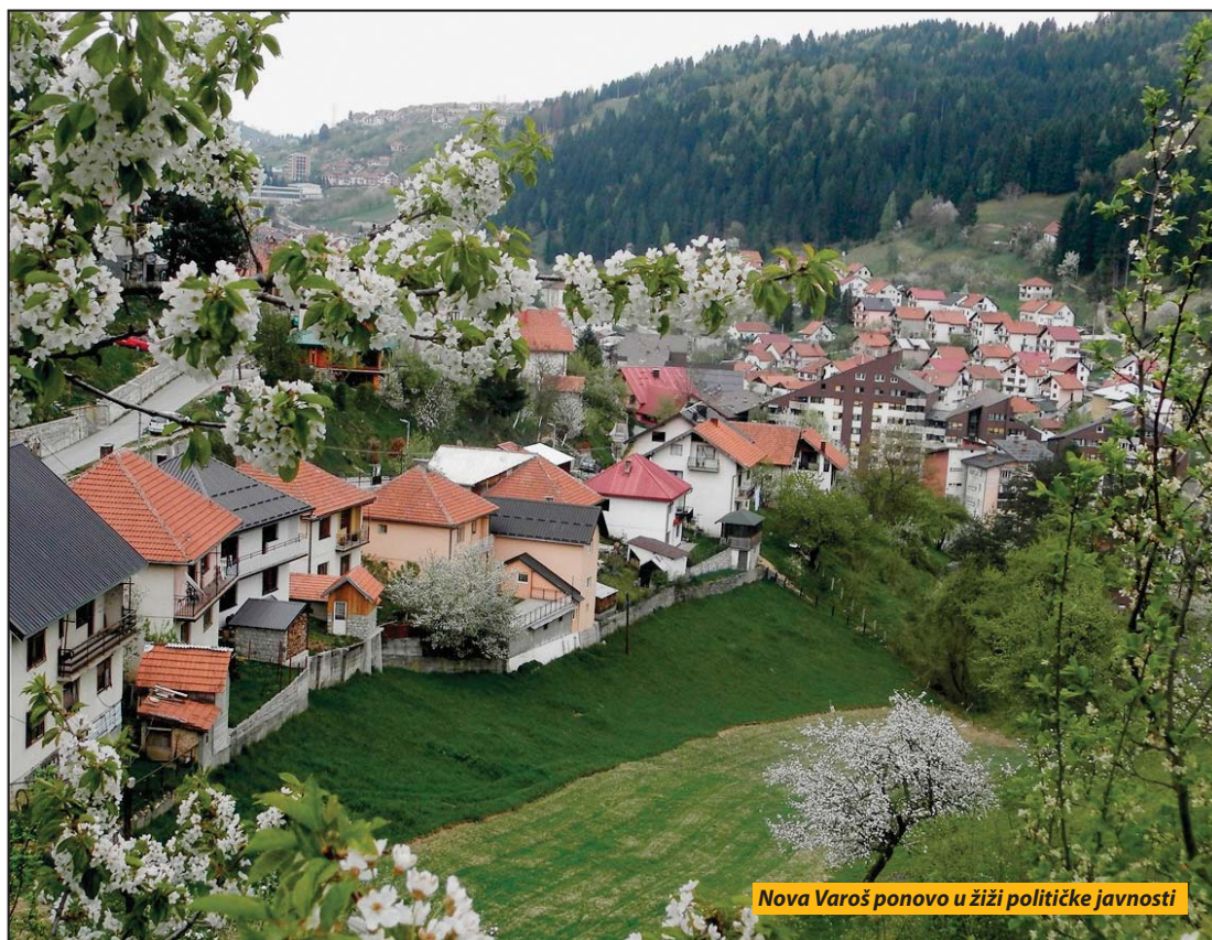
Nova Varoš ponovo u žiži političke javnosti