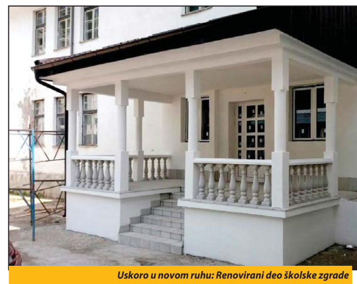
Uskoro u novom ruhu: Renovirani deo školske zgrade

Najznačajniji deo posla na rekonstrukciji zgrade je završen. Ostalo je da se sanira zbornica i još par prostora, a okvirno bi ovi radovi trebalo da budu završeni za oko mesec dana. Ni-