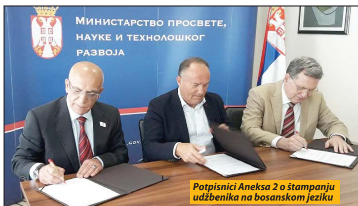
Potpisnici Aneksa 2 o štampanju udžbenika na bosanskom jeziku

Prema podacima BNV obrazovanjem na ovom manjinskom jeziku obuhvaćeno je 86 odsto bošnjačke dece u predškolskim ustanovama, osnovnim i srednjim školama u sandžačkim opštinama.