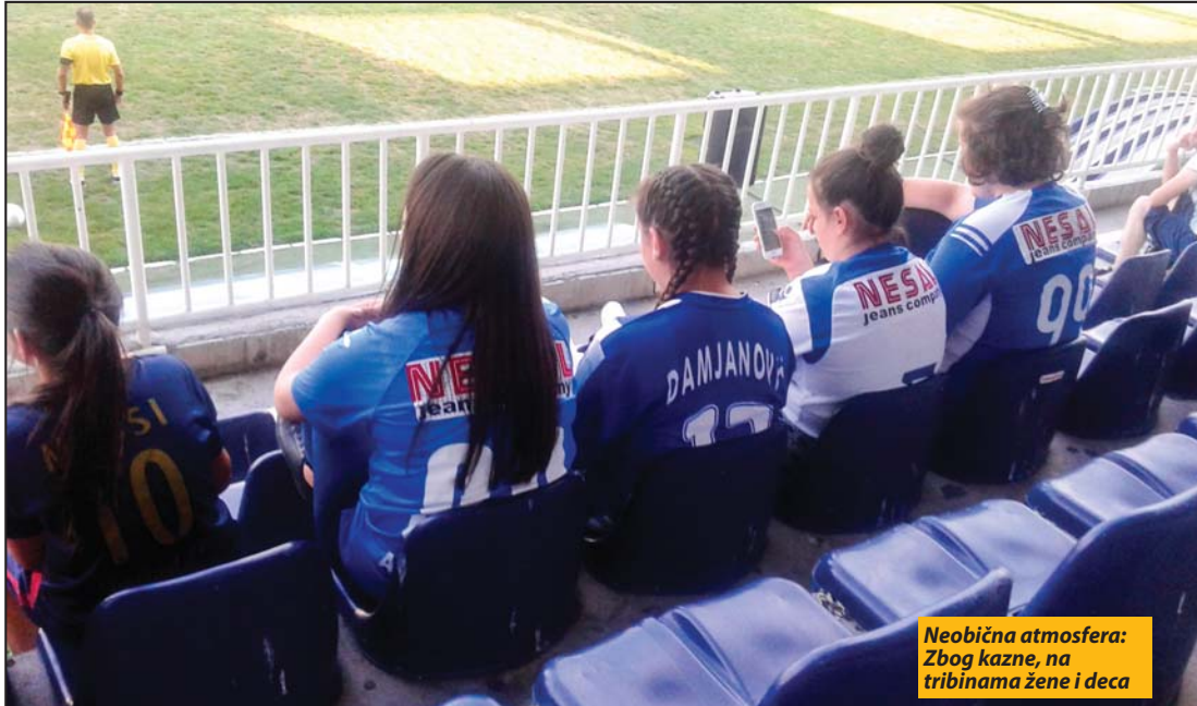
Neobična atmosfera: Zbog kazne, na tribinama žene i deca