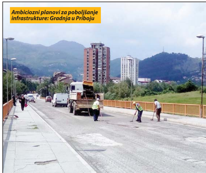
Ambiciozni planovi za poboljšanje infrastrukture: Gradnja u Priboju