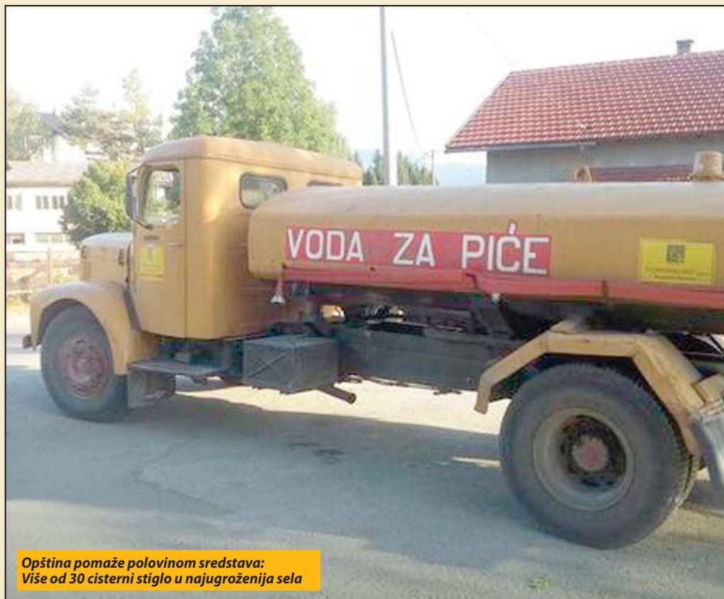
Opština pomaže polovinom sredstava: Više od 30 cisterni stiglo u najugroženija sela

Dugotrajna suša donela probleme sa vodom za piće