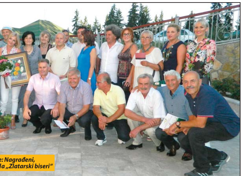
Nagrađeni, bašta „Zlatarski biseri“