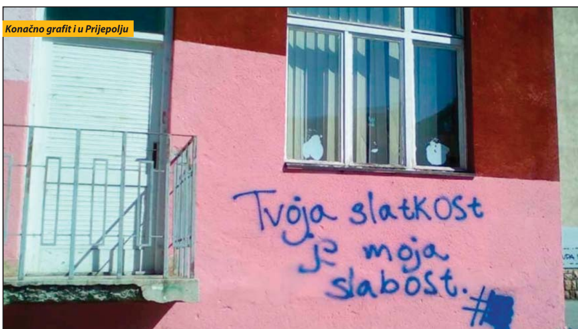
Konačno grafit i u Prijepolju

Prijepolje nema grafitu i neko bi rekao - i dobro je da je tako, ako već nema nešto kreativno da se poruči. A i niko ne bi