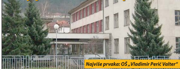
Najviše prvaka: OŠ „Vladimir Perić Valter“

Prijepolje - U osam prijepoljskih osnovnih škola nastavu će ove godine pohađati 392 učenika prvog razreda, što je 14 više nego prethodne školske godine. Najviše prvaka upisala je i najveća Osnovna škola „Vladimir Perić Valter“. Sa tri izdvojena odeljenja u ovoj školi u klupe je prvi put selo 118 đaka. Osnovnu školu „Milosav Stiković“ upisalo je ukupno 90 prvaka, dok Osnovna škola „Svetozar Marković“ u Brodarevu ove godine ima 75 učenika prvog razreda. Izdvojeno odeljenje ove škole u selu Komaran upisalo je čak 13 prvaka, a ima i 17 predškolaca. Nažalost u izdvojenim odeljenjima u selima Gostun i Slatina upisana su samo dva, odnosno jedan učenik.