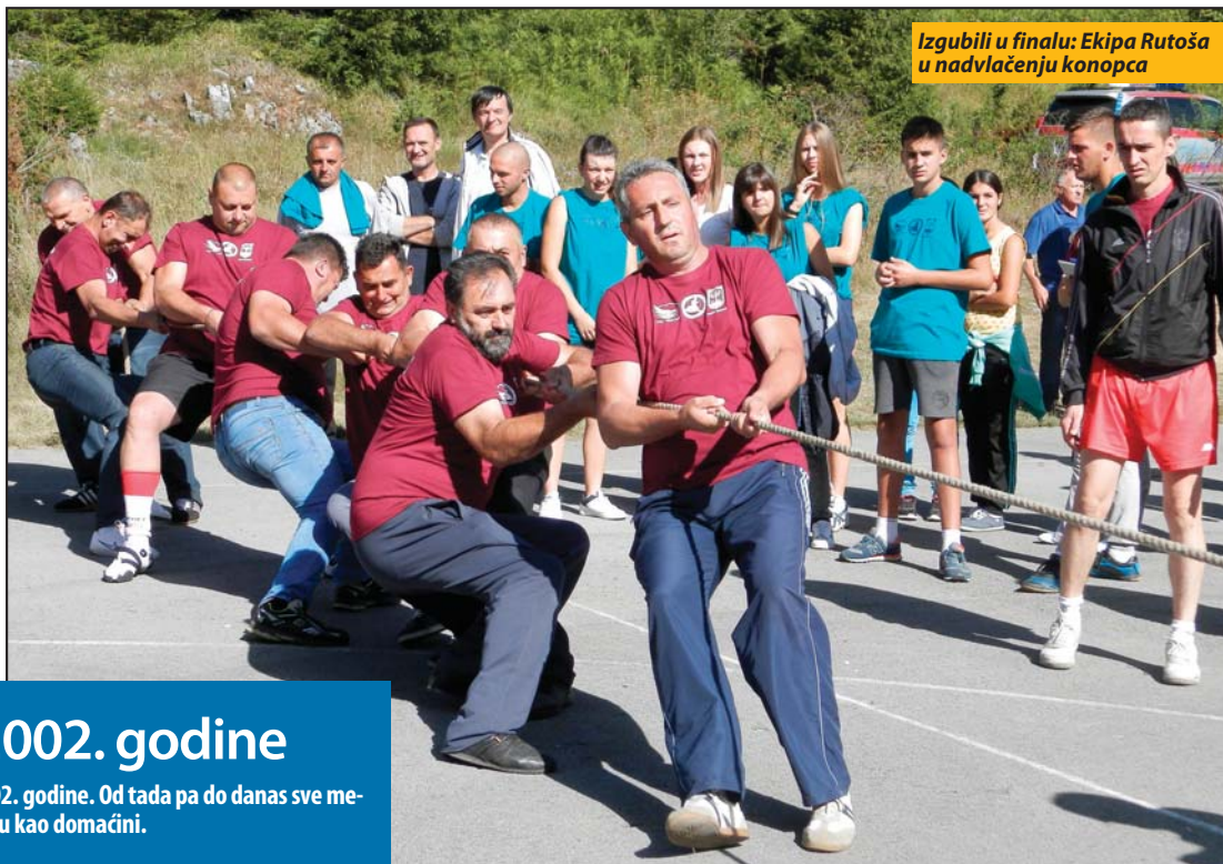
Izgubili u finalu: Ekipa Rutoša u nadvlačenju konopca