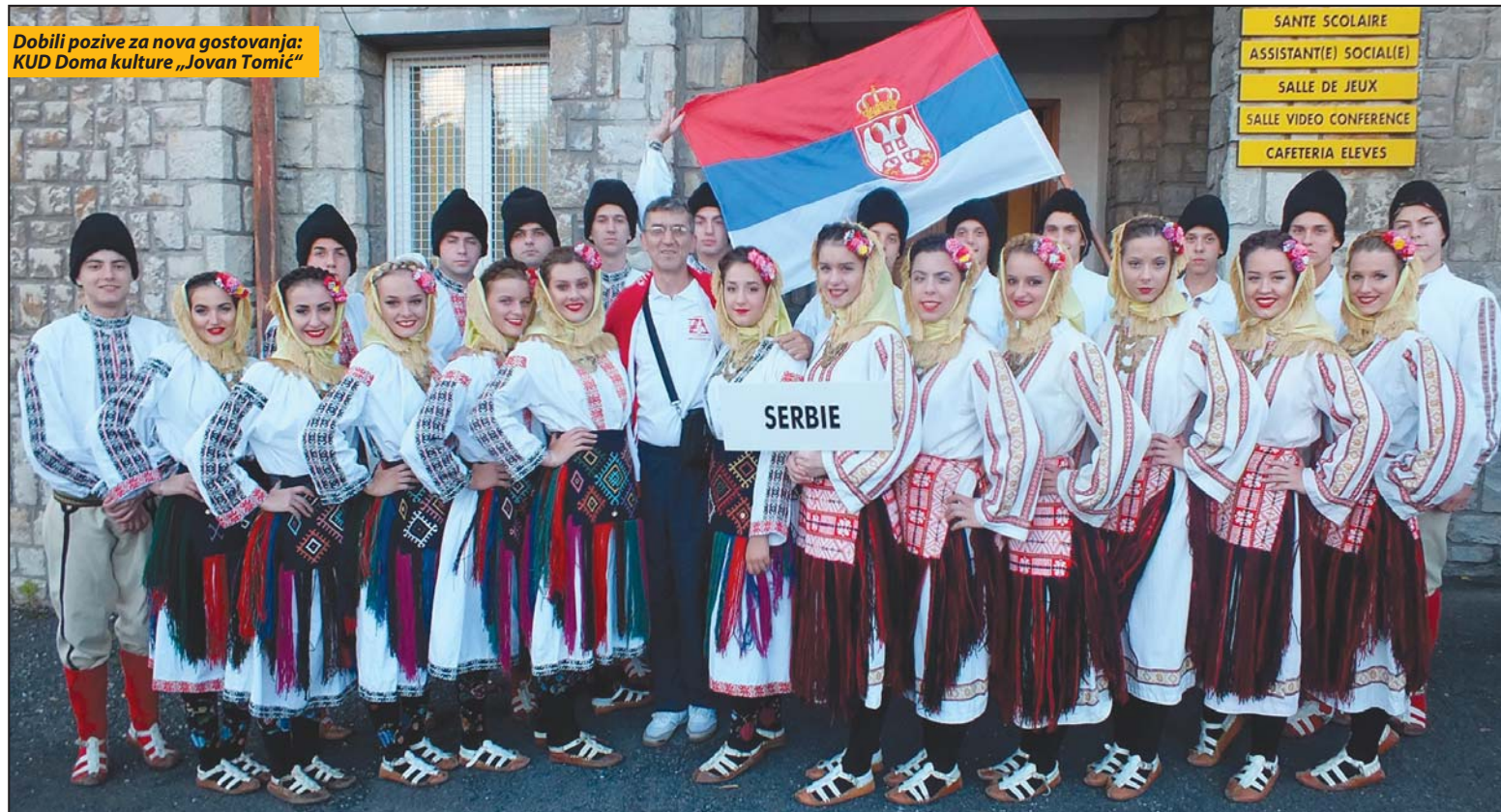
Dobili pozive za nova gostovanja: KUD Doma kulture „Jovan Tomić“

Turneja novovaroškog Folklornog ansambla