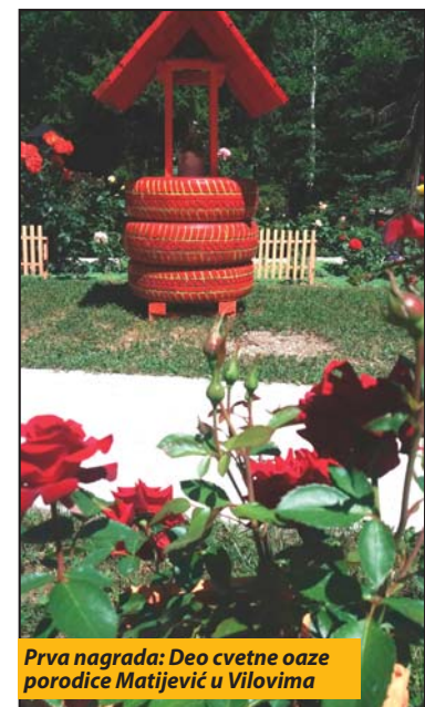
Prva nagrada: Deo cvetne oaze porodice Matijević u Vilovima

Kamenoj gori dobio vikend za dve osobe u „Zlatarskim biserima“, pumpom za prskanje cveća, domaćom rakijom, poklon vaučerom od 2.000 dinara za nabavku materijala u rasadniku, kao i keramičku saksiju za cveće. Trećenaagrađena Stojanka Dilparić je za prelepu cvetnu terasu dobila vikend za dve osobe u hotelu „Panorama“, pamučnu posteljinu i vaučer rasadnika „Tabašević“ u vrednosti od 1.000 dinara.