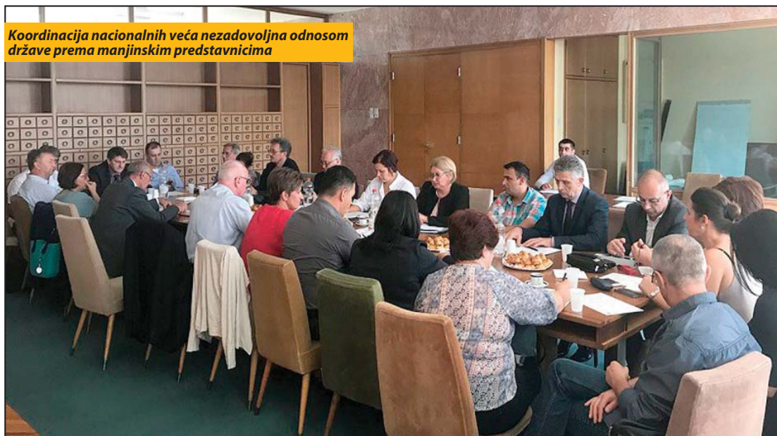
Koordinacija nacionalnih veća nezadovoljna odnosom države prema manjinskim predstavnicima

moгу imati manjinski legitimitet“ Da bi se otklonile ove prepreke, od ministara državne uprave i lokalne samouprave i predsednice republičkog parlamenta, biće zatražen hitan sastanak sa predstavnicima Koordinacije nacionalnih veća nacionalnih manjina. S.N.