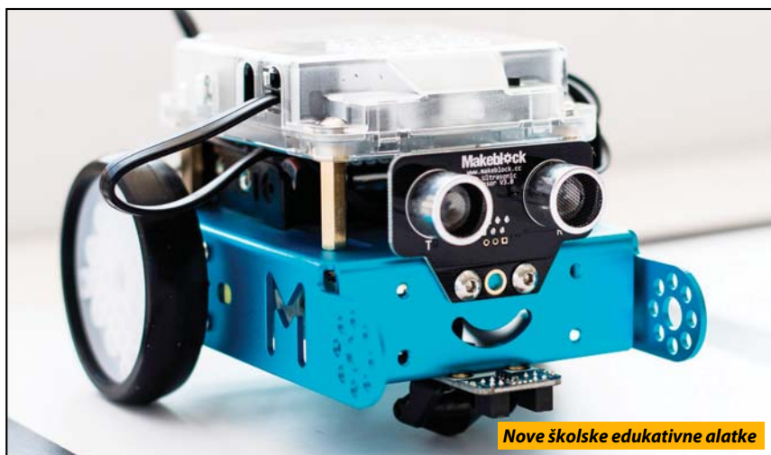
Nove školske edukativne alatke

Nova Varoš - Učenike Osnovne škole „Dobrica Rajić“ u Bistrici obradovala je nedavna donacija kompanije VIP mobile. Reč je o setu od pet mini-bot robota namenjenih za učenje osnova programiranja i kodiranja.