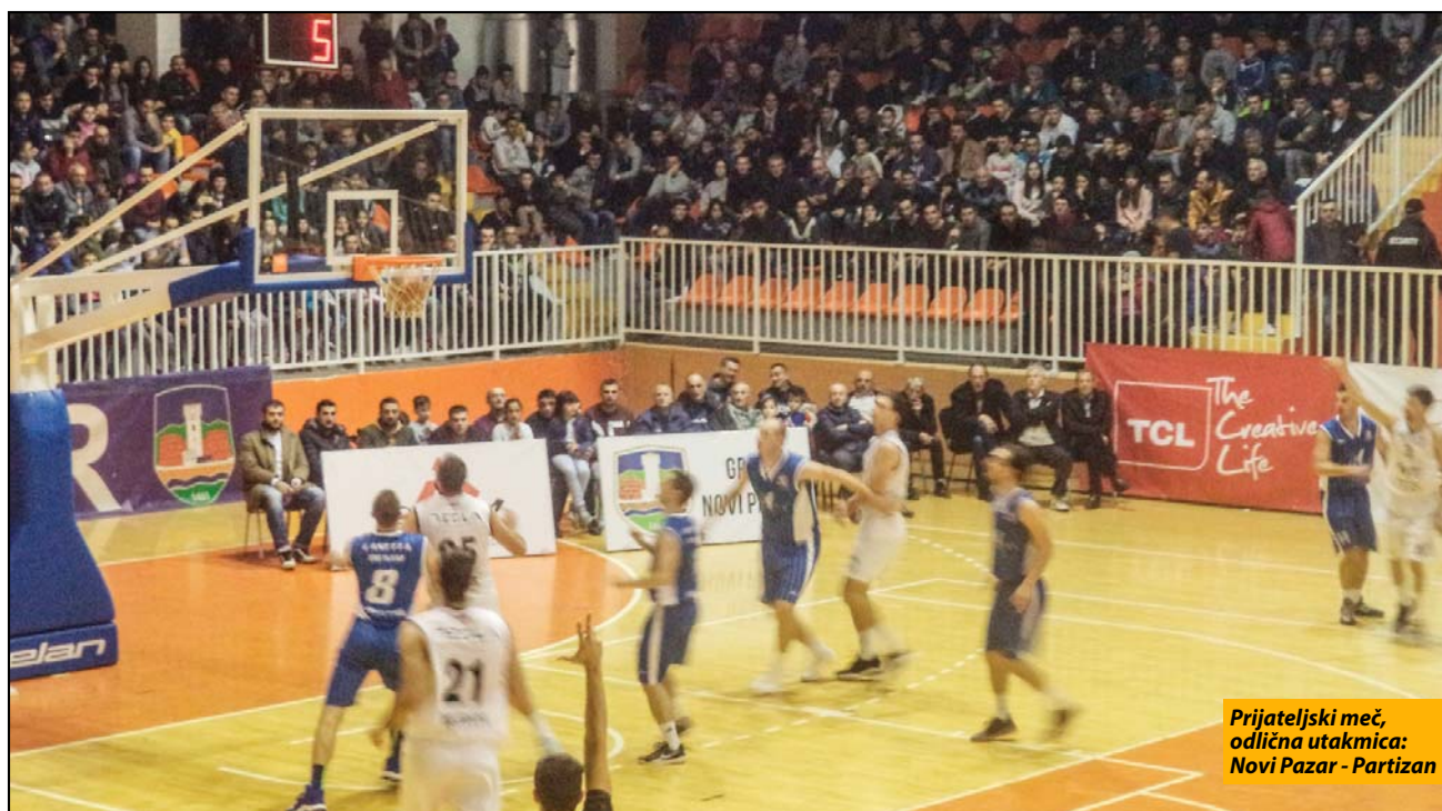
Prijateljski meč, odlična utakmica: Novi Pazar - Partizan