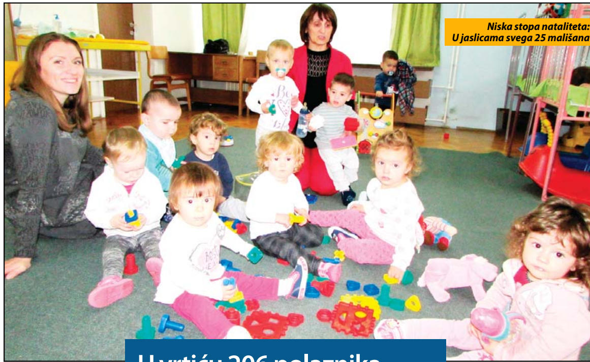
Niska stopa nataliteta: U jasicama svega 25 mališana