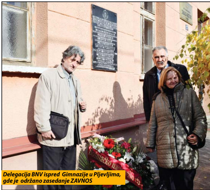
Delegacija BNV ispred Gimnazije u Pljevljima, gde je održano zasjedanje ZAVNOS

Povodom ovog praznika, delegacija BNV položila je cveće na spomen ploču na zgradi Gimnazije u Pljevljima, gde je održano zasjedanje ZAVNOS-a. Cveće je položila i delegacija Sandžačke demokratske partije