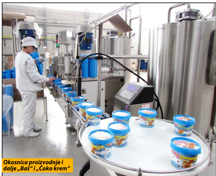
Okosnica proizvodnje i dalje „Baš“ i „Čoko krem“

- Plan je da na mesečnom nivou bude ostvaren obim proizvodnje od oko 50 šlepera oblandi i 100 šlepera napolitanki. U saradnji sa poznatim poslovnim partnerima i velikim trgovinskim lancima poput Trnave, Kirbikoa, Metroa, Međaša, Amana, robu ćemo primarno plasirati na domaće tržište, ali će jednim značajnim delom proizvodnja biti i izvozno orijentisana. Tako će