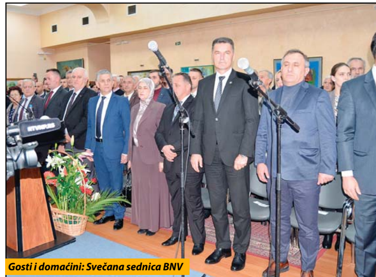
Gosti i domaćini: Svečana sednica BNV

džaka, svi zajedno, osnovali Zemaljsko antifašističko veće narodnog oslobođenja Sandžaka. Formirali su vojsku, lokalne organe vlasti, regionalne