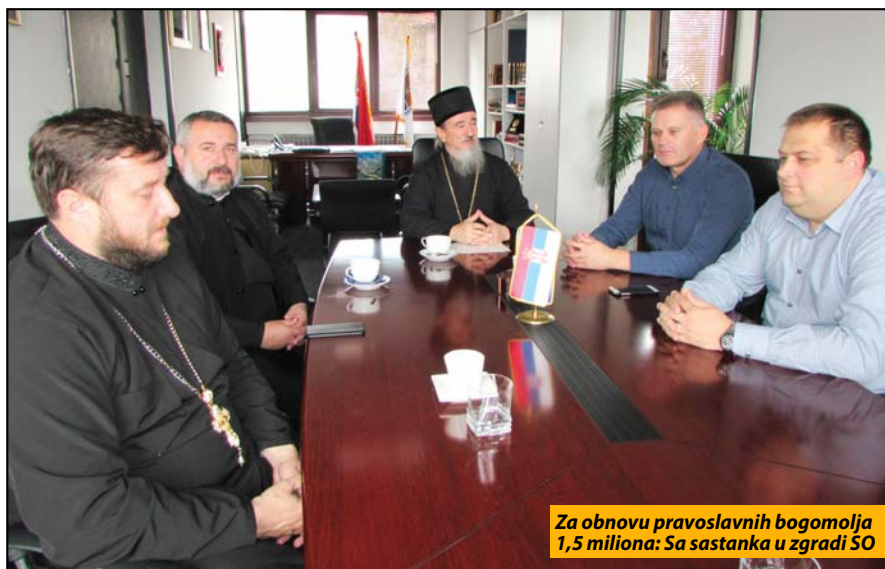
Za obnovu pravoslavnih bogomolja 1,5 miliona: Sa sastanka u zgradi SO

- Opština je putem konkursa iz budžeta za ovu godinu izdvojila oko 1,5 miliona dinara za obnovu pravoslavnih bogomolja, a pokušaćemo da u budućnosti finansijska podrška bude značajnija - kaže Bjelić. Ovo je, inače, bila prva poseta vladike Opštinskoj upravi nakon što je letos izabran za episkopa Mileševskog. R. P.