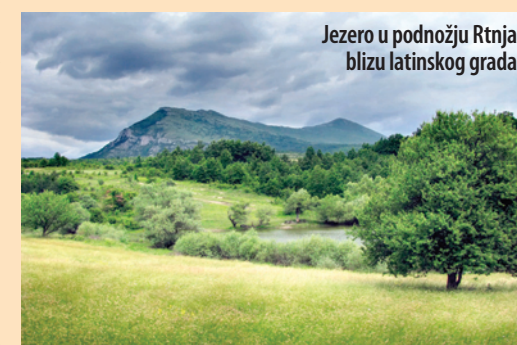
Jezero u podnožju Rtnja blizu latinskog grada

Na krečnjačkom rtu, u dolini Pakleša, kod sela Vrmdža, nalaze se zidine starog grada za koga meštani kažu da je „latinski“. Grad je iz rimskog doba i nastao je u periodu do VI veka u vreme vladavine cara Justinijana. Podignut je radi odbrane ovog dela vizantijske teritorije od prodora Avara i Slovena. Razoren je 1416. godine i to je sve što se o njemu zna u antropološko-demografskom pogledu. Kako je građen na nepristupačnim stenama i kako je bio dobro utvrđen, Turci nikako nisu mogli nikako da ga osvoje. Pored toga u grad je bila dovedena voda i veća količina hrane. Onda su (prema legendi) potplatili jednu babu, da im kaže kako da osvoje grad. Baba ih nauči da nađu konja ajgira i da mu devet dana ne daju da pije vodu, pa da ga povedu oko grada. Gde konj počne nogom kopati, tu da kopaju, jer su tu vodovodne cevi i da tu preseku vodu. Istovremeno baba poruči zapovedniku grada da će biti pobeđen, no da oni potkuju konje naopako i da kroz tajni prolaz napuste grad i tako se izvuku iz opsade. Ovi to i učiniše. Kad su Turci videli tragove, pomisliše da je u grad stiglo pojačanje, ali kada tamo uđu, za- tekoše sve pusto.