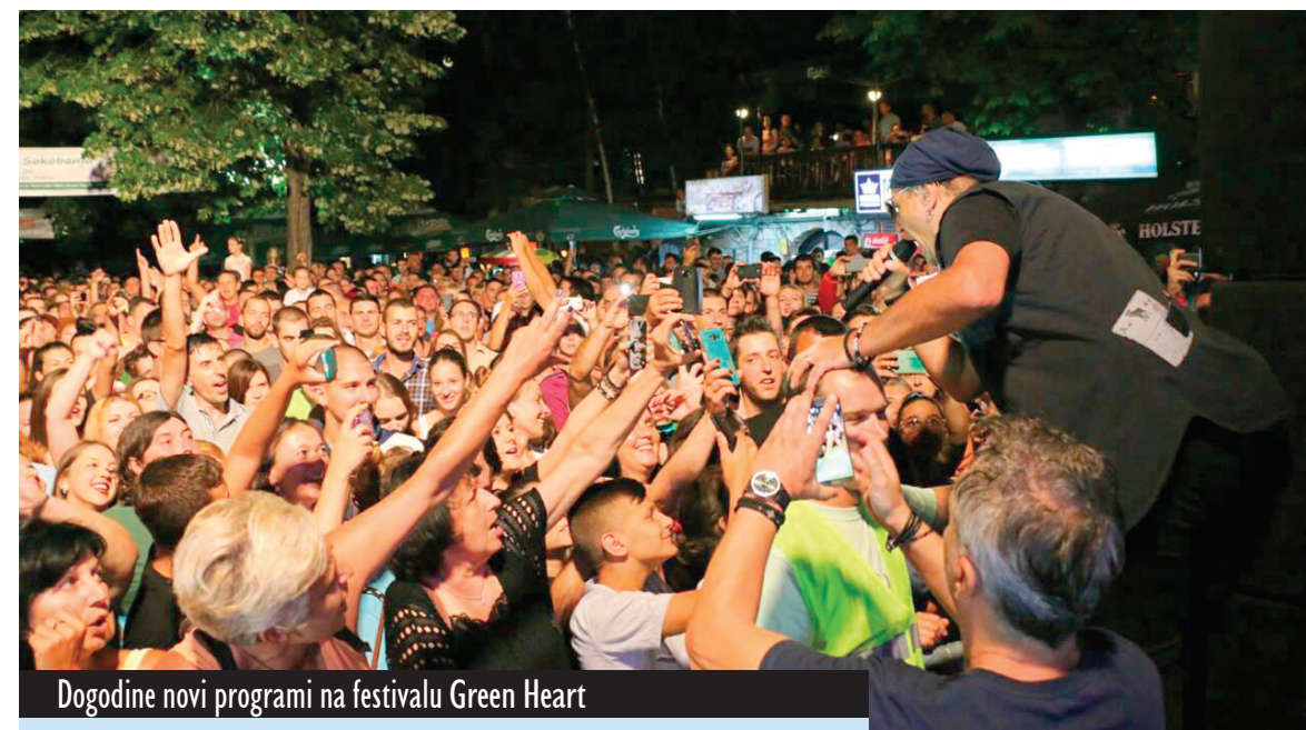
Dogodine novi programi na festivalu Green Heart

Stoga ne čudi da je Sokobanja turistički centar sa najdužom tradicijom organizovanog turizma u Srbiji, a kao početna godina organizovanog bavljenja zdravstvom i turizmom uzima se 1837. i jedna je od najposećenijih banjско-klimatskih i turističkih mesta u Srbiji i Jugoistočnoj Evropi. Strategijom srpske vlade okarakterisana je kao banja sa najviše potencijala, a nalazi se među sedam najatraktivnijih turističkih destinacija u Srbiji. Sokobanja je danas jedno od najposećenijih turističkih mesta u Srbiji i u ovoj opštini koja važi za „Zeleno srce Srbije“ s pravom kažu da ako su Andrić, Nušić, Sremac i Isidora Sekulić, pored ostalih, uživali u blagodetima Sokobanje, što to ne bi i savremeni turistički nomadi. A sve što rade za rezultat ima trend rasta broja posetilaca.