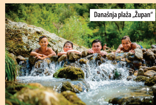
Današnja plaža „Župan“

Postoji nekoliko legendi vezanih za poznato izletišta Lepteriju. Najpoznatija je o tragičnoj ljubavi između Župana i Lepterije. Prema predanju, Župan je bio sin gospodara obližnjeg Vrmdžanskog grada, a Lepterija, kćerka tadašnjeg vladara Sokograda. Kako su Županov i Lepterijin otac stalno ratovali zbog poseda, njihova ljubav nije mogla biti krunisana brakom. Zato se Lepterija i Župan dogovore da se ona iskrade tajnim prolazom do podnožja grada, gde bi je Župan sačekao kako bi pobeegli zajedno. Kad je njen otac saznao da je pobešla, silno se naljutio i poslao sluge u poteru sa naredbom da je pogube kada je pronađu. Kada je potera stigla begunce, Lepteriju su pogubili, a Župan je od tuge skočio u najdublji vir Moravice. Tako se danas proplanak u podnožju Sokograda naziva Lepterija, a vir (danas plaža) - Župan. Druga legenda kaže da ime Lepterija potiče od grčke reči elefteria, što znači sloboda. Naime, Sokograd je nastao na ostacima rimske tvrđave, a tadašnji rimski robovi, među kojima je najviše bilo Grka, svoje kratke slobodne trenutke provodili su upravo na proplanku u podnožju tvrđave, pa su ga zato i nazvali Lepterija, u prevodu - slobodište.