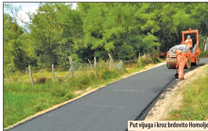
Put vijuga i kroz brdovito Homolje