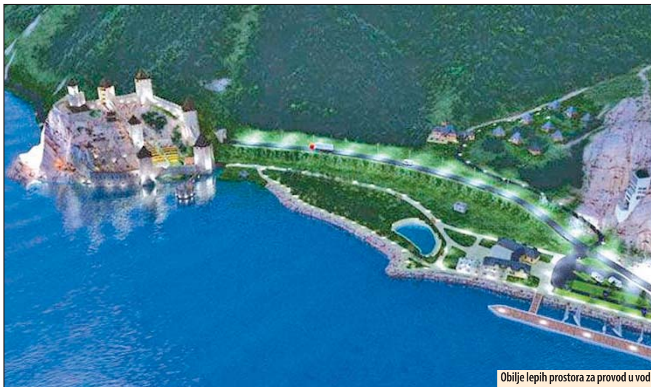
Obilje lepih prostora za provod u vodi

- Na fakultetu smo mogli da steknemo samo neka teorijska znanja, a sada se prvi put susrećemo sa praktičnim stvarima, koje će biti naša profesija, rekao je Nemanja. Z. V.