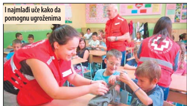
I najmlađi uče kako da pomognu ugroženima

Predavači prve pomoći i volonteri Crvenog krsta su deci preneli osnovna znanja iz prve pomoći, pokazali upotrebu trougle