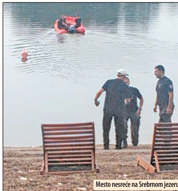
Mesto nesreće na Srebrnom jezeru