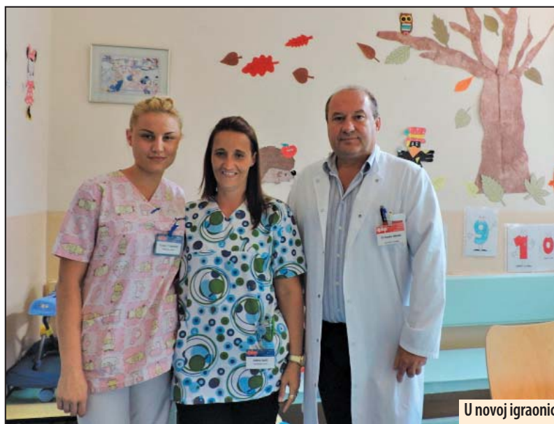
U novoj igraonici

Požarevac - Opšta bolnica Požarevac u saradnji sa Predškolskom ustanovom „Ljubica Vrebalov“ na dečijem odeljenju od nedavno realizuje radionicu „Kroz igru do zdravlja“.