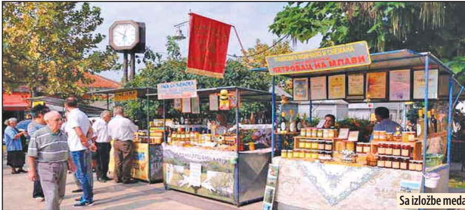
Sa izložbe meda

lo Kamenovo, poznati su po pčelarenju u celoj Srbiji i šire. Veliki doprinos stvaranju brenda „Homoljskog meda“ dalo je upravo ovo društvo pčelara, koje pored ove manifestacije ima i republičku manifestaciju, koja se organizuje svakog aprila u Kamenovu. Delatnost društva i svih pčelara sa teritorije naše opštine dokazuje da ljudi umeju da prepoznaju i poštuju ono što im omogućava opstanak i razvoj. O značaju i kvalitetu meda nije potrebno mnogo govoriti. Pčelarenje je plemenito i isplativo zanimanje, pa bih dodao da su za uspeh pčelarstva neophodni sloga i jedin-