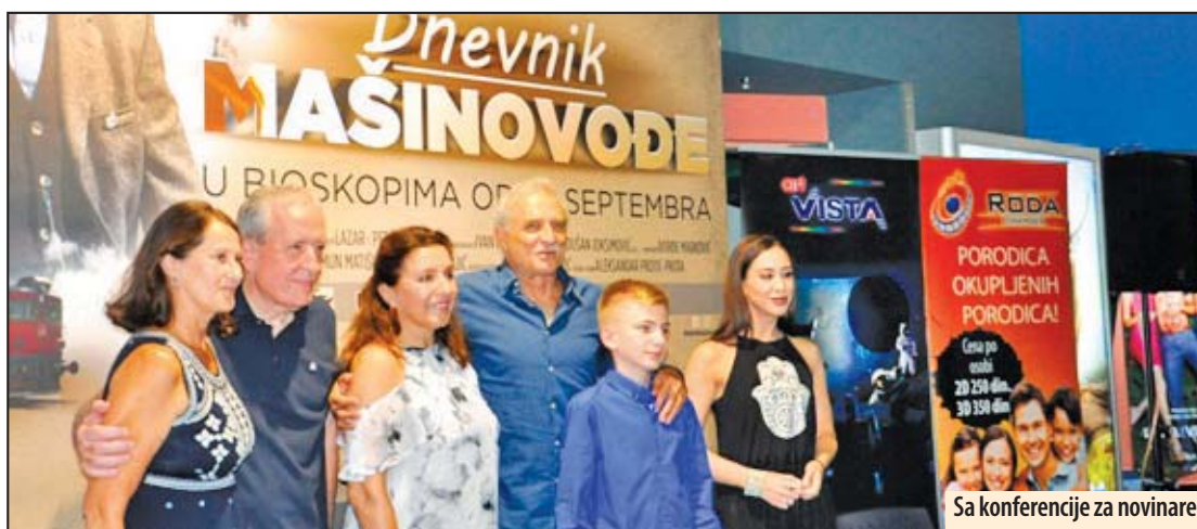
Sa konferencije za novinare

Pored unapređenja znanja i obuke iz klasičnih strukovnih veština, nova edukacija bi se bazirala na osnaživanju i stvaranju jače pozitivne uloge biblioteka, doprinoseći dobroj informisanosti građana kroz slobodan pristup znanju, kulturi, informacijama i jačanju kapaciteta za učestvovanje u slobodnom negovanju i razvijanju kulture i obrazovanja. Z. V.