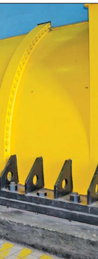
Upoznavanje sa tajnama energetike

njer instruktor Službe za obuku kadrova u ogranku TENT.