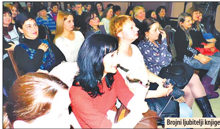
Brojni ljubitelji knjige

Požarevačka publika će narednog vikenda moći da uživa u ovom ostvarenju, odnosno od 16. do 18. septembra sa projekcijama od 18 i 20 časova u bioskopu Centra za kulturu. Cena ulaznice je 250 dinara.