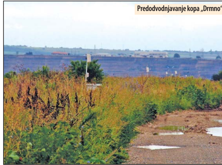
Predodvodnjavanje kopa „Drmno“

miliona kubnih metara vode. Zato su pitanje predodvodnjavanja i realizacija projekata u ovoj oblasti neprestano u žiži interesovanja u rudarskom sektoru ogranka „TE-KO Kostolac“.