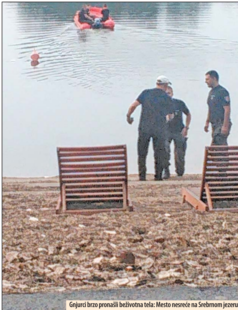
Gnjurci brzo pronašli beživotna tela: Mesto nesreće na Srebrnom jezeru