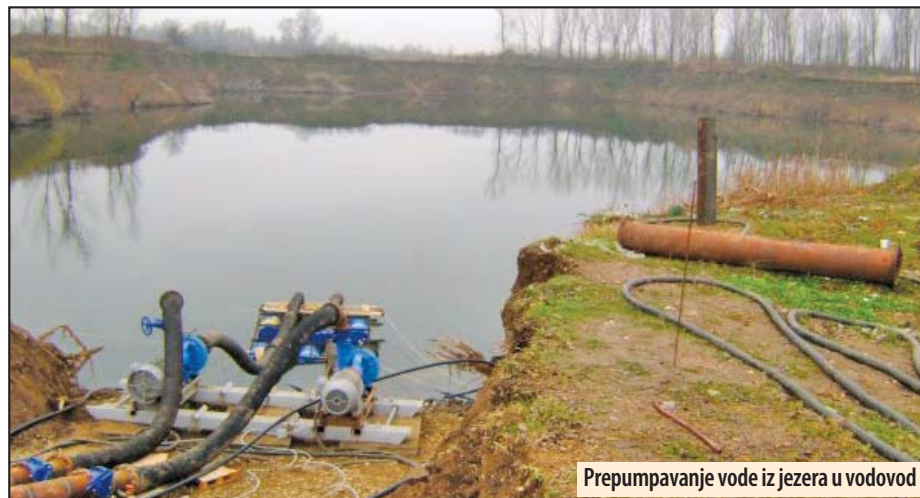
Prepumpavanje vode iz jezera u vodovod

Požarevac - Vanredna situacija, prouzrokovana dugotrajnim problemima u vodosnabdevanju grada Požarevca, je ukinuta. Naime, Gradski štab za vanredne situacije grada Požarevca razmatrao je stanje u sistemu vodosnabdevanja grada Požarevca i jednoglasno doneo predlog o ukidanju vanredne situacije u naseljenom mestu Požarevac i prigradskim naseljima Ljubičevo i Zabela.