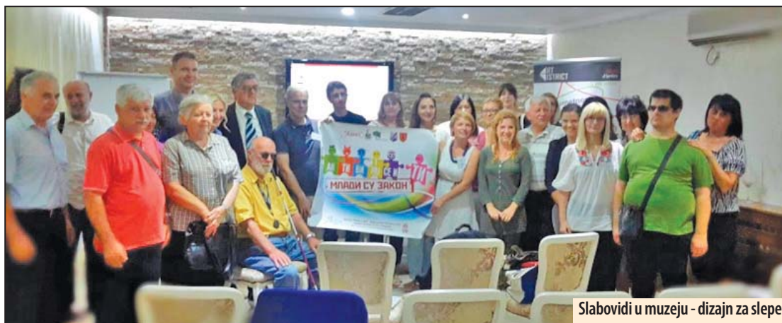
Slabovidi u muzeju - dizajn za slepe

kulture, gde smo imali prilike da od slepih i slabovidnih ljudi iz „prve ruke“ čujemo u kojim svim sferama života nailaze na poteškoće. To što mi ne vidamo slepa i slabovidna lica na kulturnim aktivnostima u gradu, ne znači da slepi nisu zainteresovani za kulturu, već naprotiv, da nisu na pravi način informisani, da im sama fizička barijera