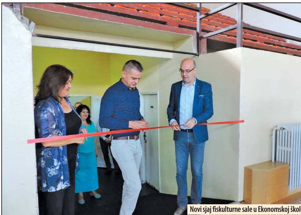
Novi sjaj fiskulturne sale u Ekonomskoj školi

Sportska hala Ekonomsko trgovačke škole u Požarevcu dobila novu podlogu