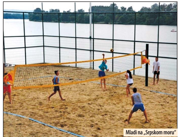
Mladi na „Srpskom moru“

Program na sceni otvorila su dva plesna studija, „FANTASY“ iz Vlasotinca i „SPEKTAR“ iz Kraljeva. U nastavku programa predstavili su se mladi rok sastavi, a muzičari su dominirali na sceni. Odličan utisak su osta-