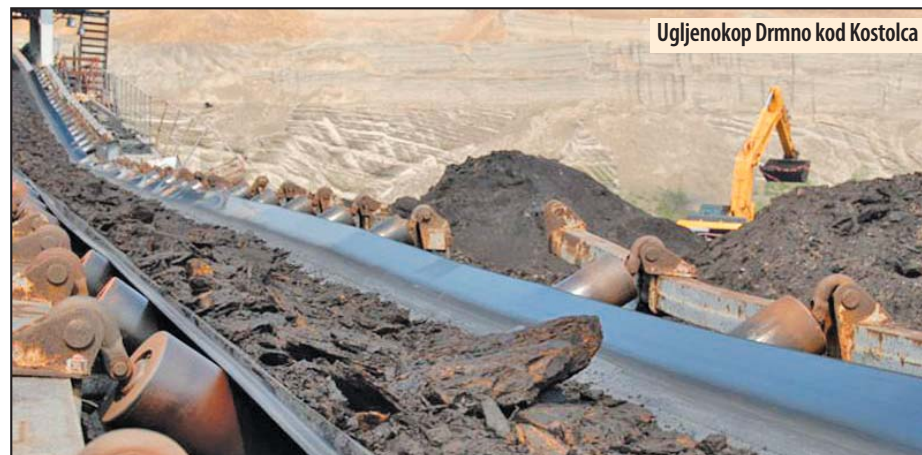
Ugljenokop Drmno kod Kostolca