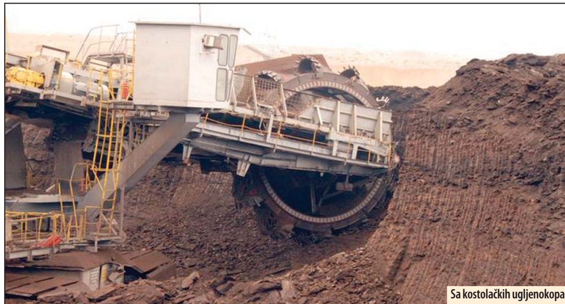
Sa kostolačkih ugljenokopa

Kostolac - Ogranak „TE-KO Kostolac“ ostvaruje ovogodišnje proizvodne planove u rudarskom sektoru, konstatuje izvor EPS Energija. Za sedam meseci rada na Površinskom kopu „Drmno“ iskopane su 4.772.762 tone uglja, što je na nivou plana.