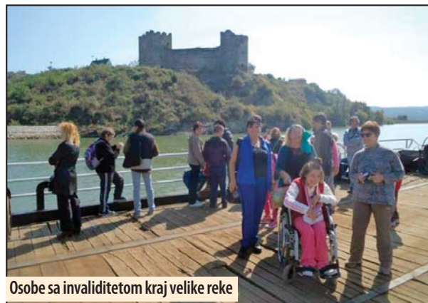
Osobe sa invaliditetom kraj velike reke