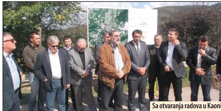
Sa otvaranja radova u Kaoni