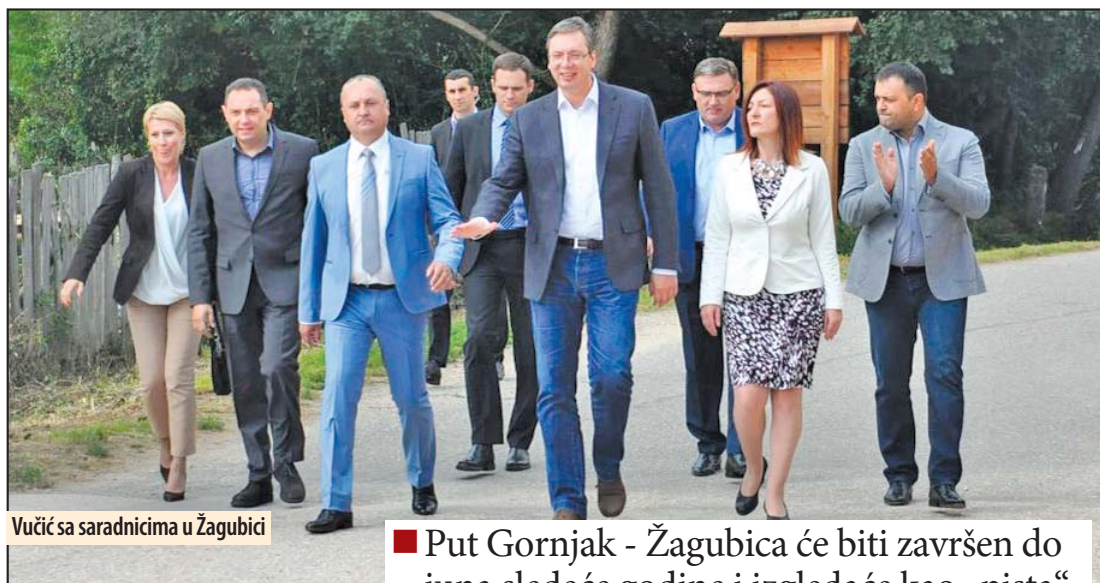
Vučić sa saradnicima u Žagubici

■ Put Gornjak - Žagubica će biti završen do juna sledeće godine i izgledaće kao „pista“