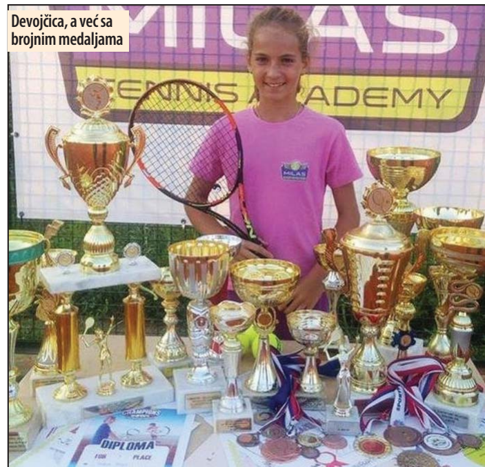
Devojčica, a već sa brojnim medaljama

Inače, đačke uniforme u Srbiji prvi put su nosili učenici liceja u prvoj polovini 19. veka. Učenice su nosile crne satenske gornje haljine (kecelje) sa belim kraginama i teget beretke, a učenici samo crni ili teget kačket sa rimskom oznakom za razred. Mnoge škole i države napustile su praksu uniformi u drugoj polovini 20. veka. One su, međutim, i dalje prisutne