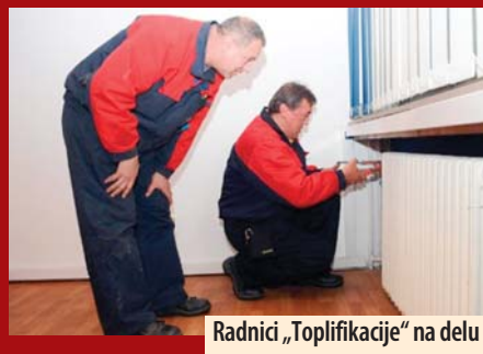
Radnici „Toplifikacije“ na delu

Požarevac - Od oko 8.800 korisnika, koliko ih ima požarevačko javno preduzeće „Toplifikacija“, na zahtev korisnika, sa toplovoda je dosad isključeno njih 439, od kojih su skoro svi gastarbajteri. Od ovog broja, 362 isključeno je privremeno, a