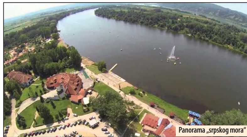
Panorama „srpskog mora“