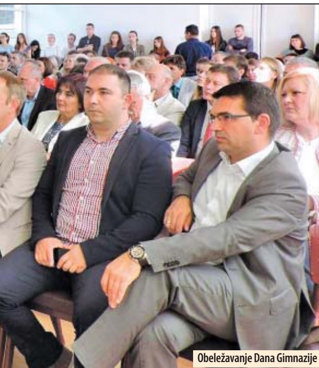
Obeležavanje Dana Gimnazije

učestvovala su 92 učenika i osvojene su 24 nagrade. Naša škola je predložena za najviše priznanje u oblasti obrazovanja za Svetosavsku nagradu, zaključila je Žukovski. Najboljem matematičaru učeni-