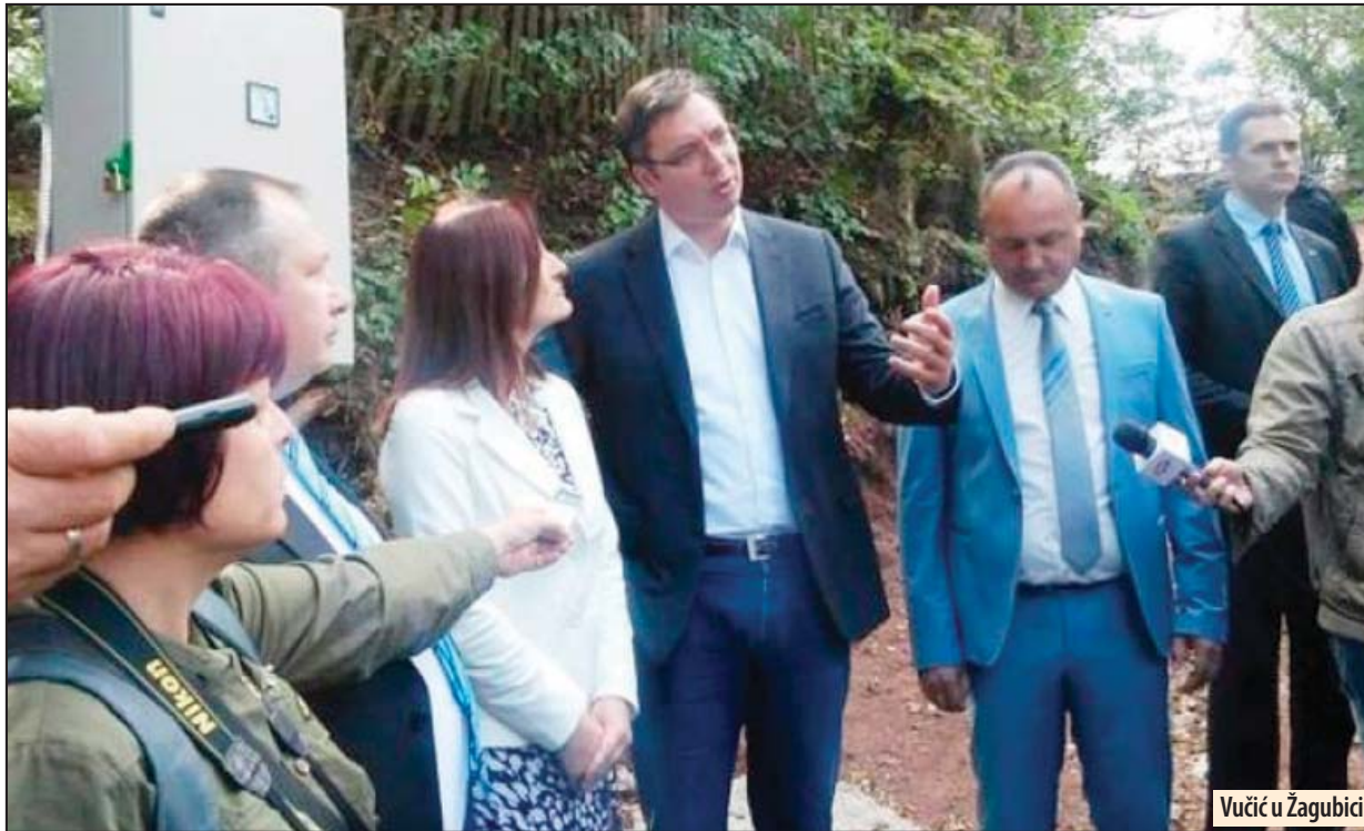
Vučić u Žagubici

je da dođete sa gotovim projektima. Spremnim smo da ukoliko neko želi da napravi fabriku, da obezbedimo sve pristupne saobraćajnice, samo morate doći sa projektima, naglasio je premijer i dodao.