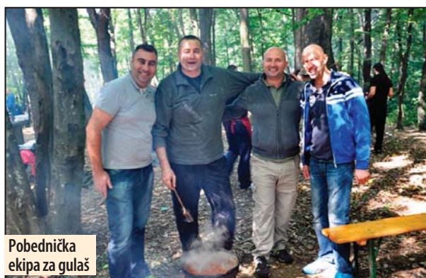
Pobednička ekipa za gulaš

Ekipa „Sam protiv svih“ iz Požarevca, osim gulaša, spremala je i čorbast pasulj za sve