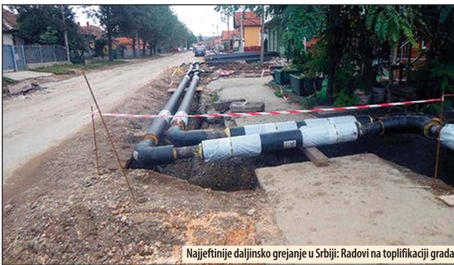
Najjeftinije daljinsko grejanje u Srbiji: Radovi na toplifikaciji grada

Za grejanje prosečnog dvosobnog stana čija je površina oko 50 kvadrata, u Požarevcu se mesečno plaća samo oko 2.000 dinara. Ovo je, u odnosu na ostale gradove u Srbiji, veoma povoljna cena, pa se zato građani i ne odriču takvog vida grejanja, pošto je svako drugo znatno skuplje, bilo da se radi o grejanju na struju, na drva ili naftu. Do prošle jeseni grejanje se plaćalo prema površini, odnosno kubikaži objekta, ali je od septembra prošle godine uveden novi tarifni sistem. Ovaj sistem sastoji se iz dva dela - fiksnog, koji čini 80