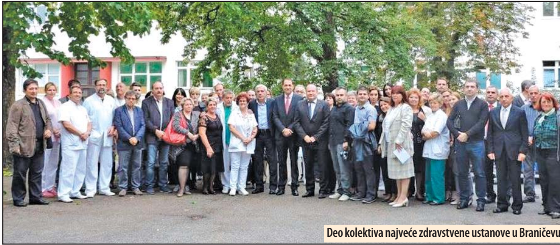
Deo kolektiva najveće zdravstvene ustanove u Braničevu

Opšta bolnica u Požarevcu obeležila svoj dan