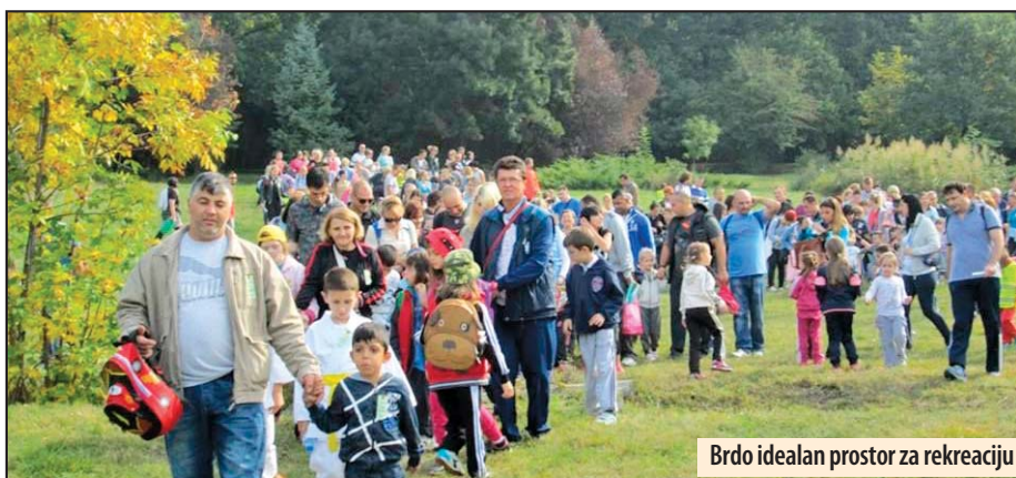
Brdo idealan prostor za rekreaciju

Planinarski klub „Vulkan“ iz Požarevca je pre četiri meseca po prvi put pristupio programu „Pešačenje i planinarenje“, kao izbor zdravog načina života (bilo je 350 učesnika) koji najvećim delom zagovara i finansira Ministarstvo omladine i