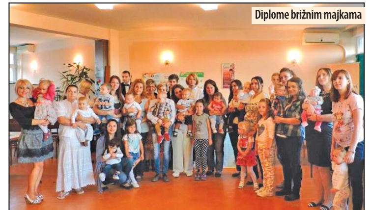
Diplome brižnim majkama

Nakon prigodnog programa, pripremljenog od strane mališana iz vrtića „Bambi“, uručene su 33 zahvalnice i po jedna ruža majkama za njihovo brižno roditeljstvo. Inače, Svetska nedelja dojenja je globalna kampanja koja se održava u oko 150 zemalja sveta, čiji je cilj