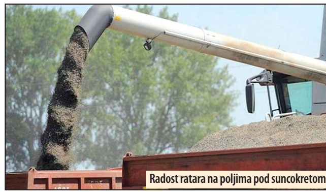
Radost ratara na poljima pod suncokretom

PSSS. Na ovom području suncokret je posejan na oko 7,5 hiljada hektara. Z. V.