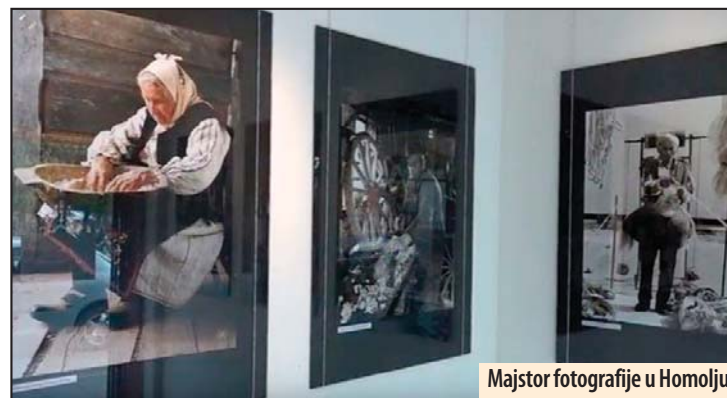
Majstor fotografije u Homolju

Požarevac - Organizacija „Prijatelji dece“ u saradnji sa Predškolskom ustanovom „Ljubica Vrebalov“, školama i drugim organizacijama, u periodu od 3. do 9. oktobra, nizom manifestacija pod sloganom „Neću da brigam, hoću da se igram!“, obeležava Deciju nedelju. Prvog dana manifestacije mališani su crtali po betonu ispred platoa Centra za kulturu Požarevac, dok je u Holu ove ustanove postavljena je izložba radova pod nazivom „Svako dete ima pravo“. Posetioci izložbu mogu pogledati do petka, 7. oktobra. Takođe, korisnici Centra za dnevni boravak dece i omladine ometene u razvoju u saradnji sa članovima Udruženja 8. dan i učenicima OŠ organizovali su radionicu „Svi treba da znaju šta drugarstvo znači“ u okviru koje su izradili poster sa porukama prijateljstva. Z. V.