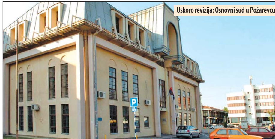
Uskoro revizija: Osnovni sud u Požarevcu