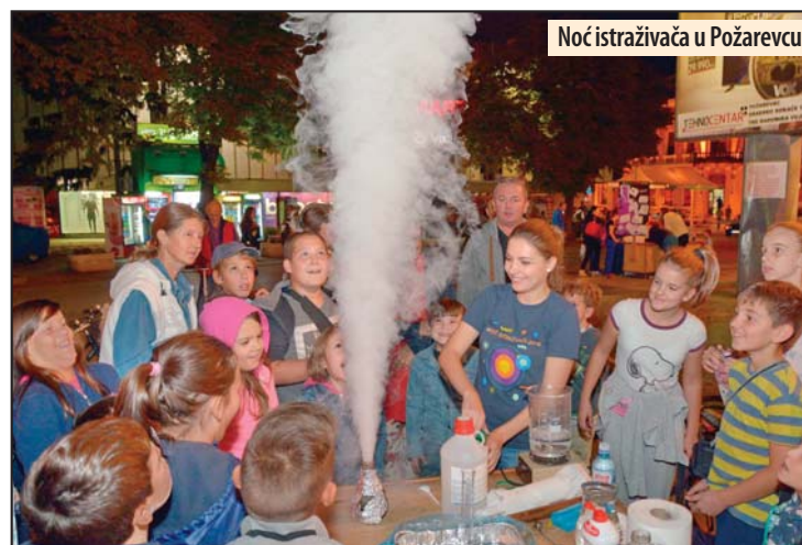
Noć istraživača u Požarevcu