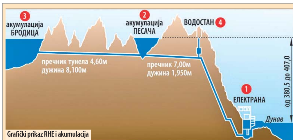
Grafčki prikaz RHE i akumulacija