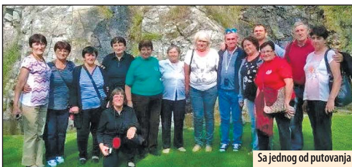
Sa jednog od putovanja

Verovatno je to i razlog što su iz godine u godinu sve brojniji, tako da u ovom trenutku imaju preko 1.400 članova. O njihovom zadovoljstvu dovoljno govore i nasmejana lica na fotografijama sa putovanja. Po izuzetno niskim cenama, članovi ove organizacije redovno obilaze gotovo sva turistička mesta u Srbiji, uživajući tako u svom trećem dobu. M. V.