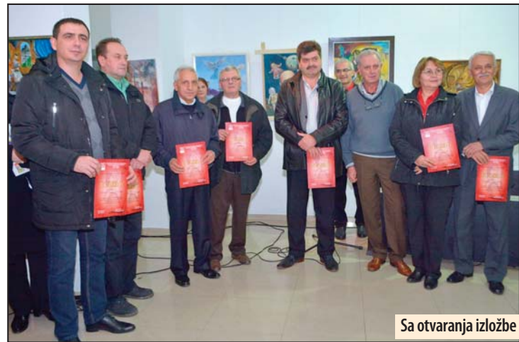
Sa otvaranja izložbe

Stihove na italijanskom, francuskom i srpskom jeziku govorili su učenci Požarevačke gimnazije, a na španskom đaci škole „Sveti Sava“. Z. V.