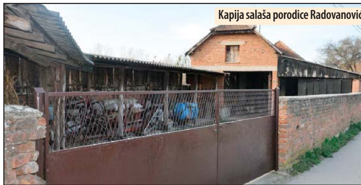
Kapija salaša porodice Radovanović