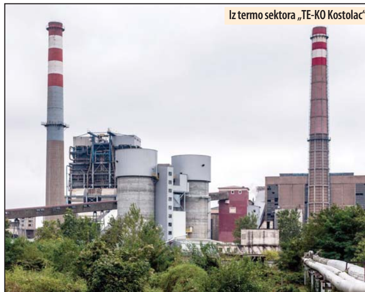
Iz termo sektora „TE-KO Kostolac“

- „TE-KO Kostolac“ omogućava grejanje tokom zimskih meseci za ovaj kraj, a proizvodnja električne energije je usklađena i s poštovanjem ekoloških propisa, što rezultira ulaganjem u sa vremene projekte. U TE „Kostolac A“ počeo je sa radom novi sistem za transport pepela i šljake, koji implementira ekološke postulate i omogućava zatvaranje stare deponije pepela, dok će u TE „Kostolac B“ početi da radi postrojenje za odsumporavanje dimnih gasova.