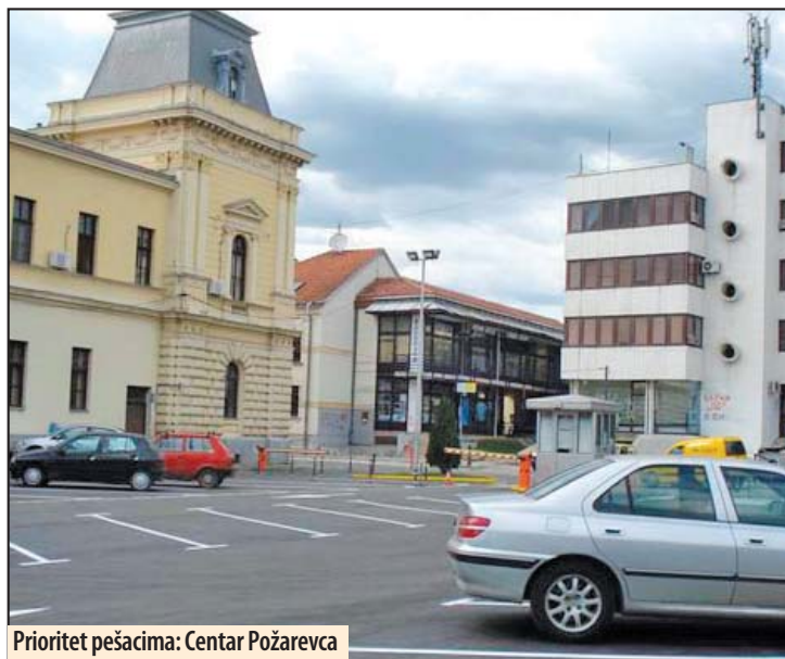
Prioritet pešacima: Centar Požarevca

U Požarevcu postoji pet zatvorenih parkinga: pored zgrade nekadašnje robne kuće „Beograd“ u Sindelićevoj ulici, kod zelene pijace „Krug“, preko puta hotela „Dunav“, pored Osnovnog suda i kod Centra za kulturu. Na njima je, ukupno, više od 300 mesta za