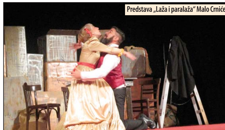
Predstava „Laža i paralaža“ Malo Crniće

Požarevac - Predstavom „Laža i paralaža“ Amaterskog pozorišta „Branislav Nušić“ iz Malog Crnića, u Centru za kulturu u Požarevcu 25. novembra počinje Smotra dramskih amatera Pomoravlja i Podunavlja „Živka Matić“, deveta po redu.