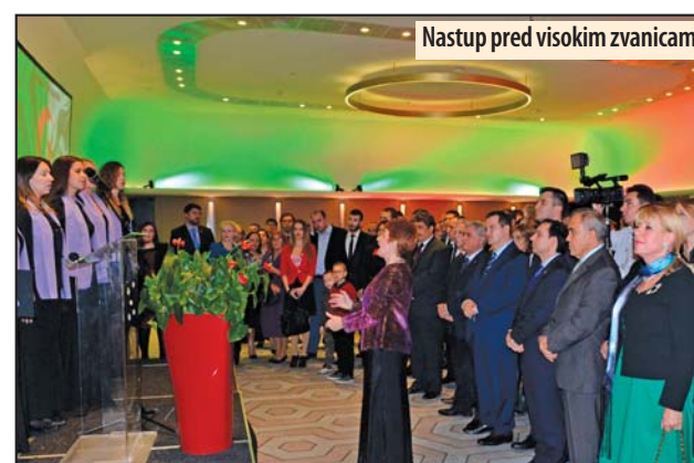
Nastup pred visokim zvanicima

među alžirskog i srpskog naroda, koje datiraju još iz pedesetih godina prošlog veka, kada je bivša Jugoslavija pružila višestruku podršku Alžiru u borbi za oslobođenje od kolonijalne zavisnosti. U tom kontekstu je i istorijska poseta predsednika Tomislava Nikolića Alžiru,