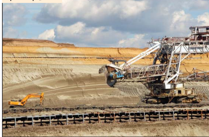
Pripreme kopa „Drmno“

dišnje radne aktivnosti na Površinskom kopu „Drmno“ bile su usmerene na realizaciju ovogodišnjeg plana proizvodnje otkrivicama i uglja, investici-