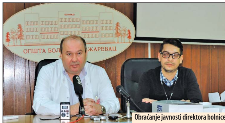
Obraćanje javnosti direktora bolnice

Nova zgrada Prekršajnog suda u Požarevcu imaće površinu od oko 700 metara kvadratnih, a rok za završetak jeste jun 2017. godine. Z. V.