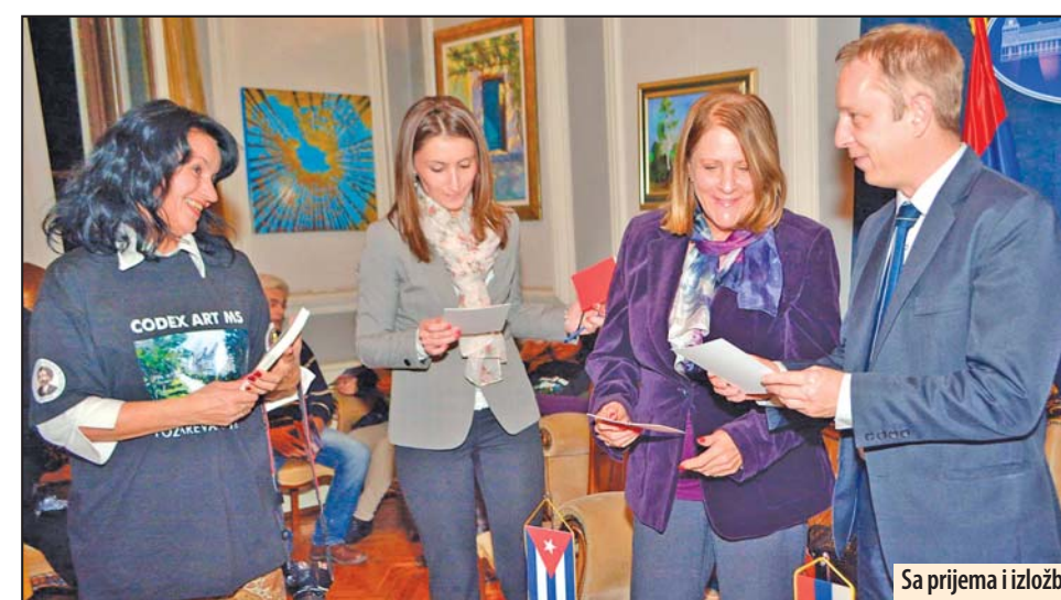
Sa prijema i izložbe

On je posebno istakao zadovoljstvo činjenicom da su okupljeni meštani Lučice bili različitim političkih opredeljenja te je i zbog toga pohvalio rukovodstvo Mesne zajednice što je izbegnut stranački kontekst ove izvanredne akcije. Z. V.