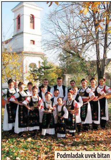
Podmladak uvek bitan

Manifestacija je počela 9. jula smotrom folklora „Ostrovački bečarac“, a zatim je 11. jula usledile isti program sa početkom u 20 časova. Veče poezije i etno muzike bilo je rezervisano za 12. jul, dok je 13. jula održana priredba OŠ Ostrovo i zabava za najmlađe „Igrice bez granica“. Koncert tamburašica „La banda“ iz Novog Sada, održaće se večeras, sa početkom u 20 časova.