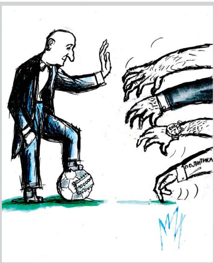
Ilustracija: M. Đerlek