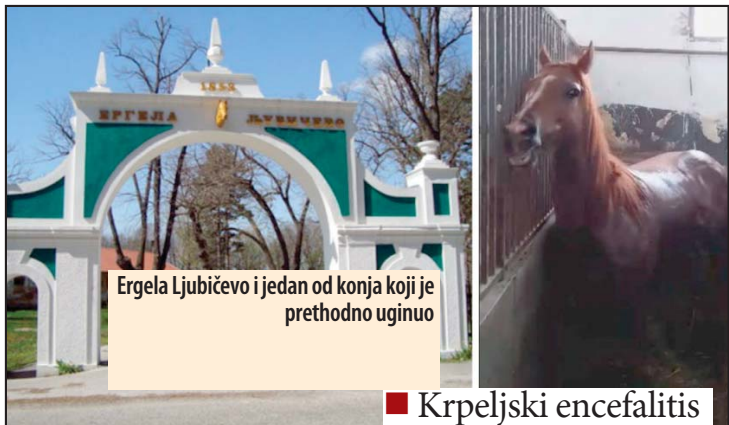
Ergela Ljubičevo i jedan od konja koji je prethodno uginuo

circulacije, tzv. „slonovske noge“, koja izaziva velike otkoče na nogama konja. Usled velikih vrućina, kobila nije izdržala i uginula je, objasnio je direktor. On je dodao da je nakon uginuća konja u Ljubičevo došla veterinarska inspekcija, koja je načinila izveštaj o tome i naložila da se leš zakopa.