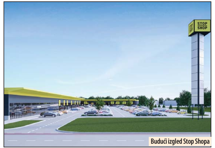
Budući izgled Stop Shopa

2017. godine. Podsetimo, Grad Požarevac je Fabriku šećera kupio prošle godine. Tada je uplaćeno blizu 300 miliona dinara za 11 parcela u okviru kupljene fabrike u stečaju. Danas Fabrika šećera i dalje nema aktivnih proizvodnih pogona. B. D.