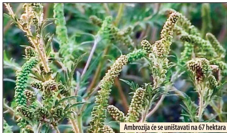
Ambrozija će se uništavati na 67 hektara

U Požarevcu veće površine koje će biti tretirane su Sopot, Čačalica, Lučki put, Rasadnik, Tulba, Jugovićeve ulica, Vašarište, a ove godine zahvaljujući uvećanim sredstvima biće obuhvaćene i seoske mesne zajednice gde će ambrozija biti uništavana oko školskih dvorišta. Nadam se da će celokupan posao biti obavljen pre maksimalne polinacije u vazduhu. Ambrozija je najrasprostranjenija i najopasnija alergogena biljka na svetu, jer stvara visoku koncentraciju polena u vazduhu, izaziva peckanje u očima, upalu sinusa, upalu grla i alergijsku kijavicu, koja ako se blagovremeno ne leči prelazi u alergijsku astmu, istakao je Rakić. On je podsetio vlasnike privatnih parcela i preduzeća da su dužni da sami uklone ovaj alergen sa svojih poseda. Reč naroda i B. D.