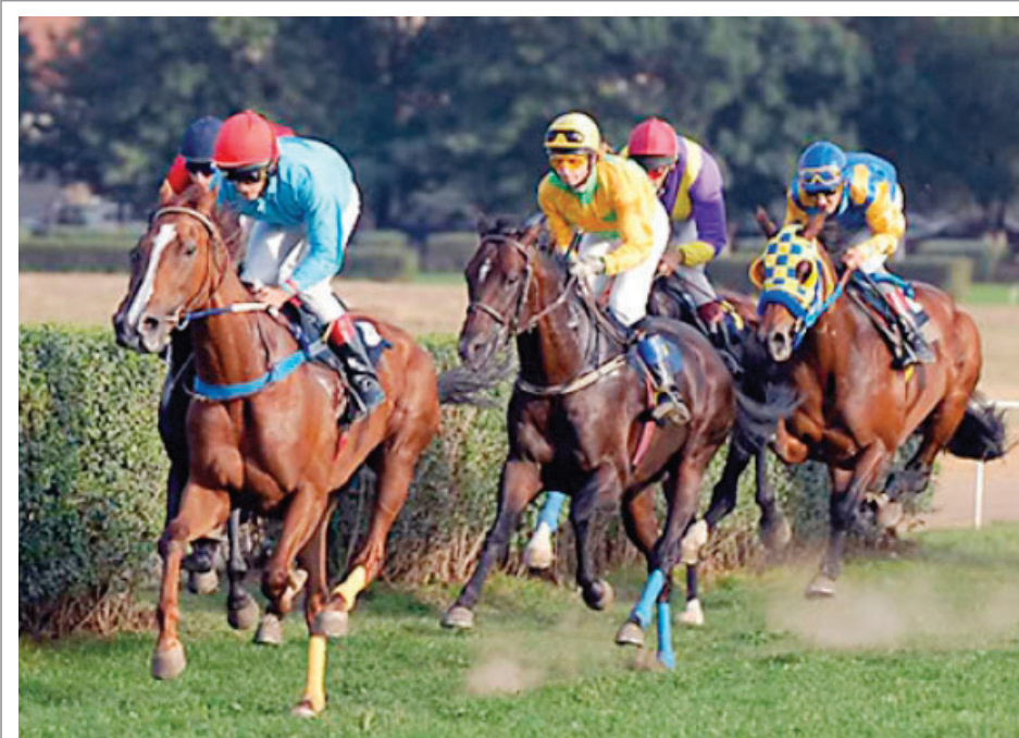
Ivanjdanski sastanak na Hipodromu