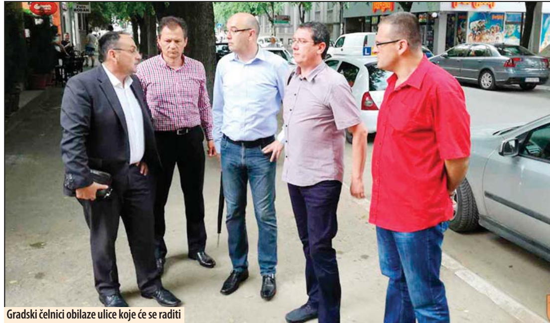
Gradski čelnici obilaze ulice koje će se raditi

mesecu u ulici Čede Vasovića na sređivanju trotoara, gde će se radovi odvijati od benzinske stanice do kružnog toka na izlasku iz grada. On je dodao da će se ulica Čede Vasovića raditi fazno,