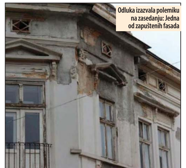
Odluka izazvala polemiku na zasjedanju: Jedna od zapuštenih fasada

prioriteta zainteresovanih vlasnika posebnih delova zgrada. Bitni uslovi za učešće u postupku jesu da se uz prijavu dostavi potrebna tehnička dokumentacija i da su obezbeđena finansijska sredstva od strane vlasni-