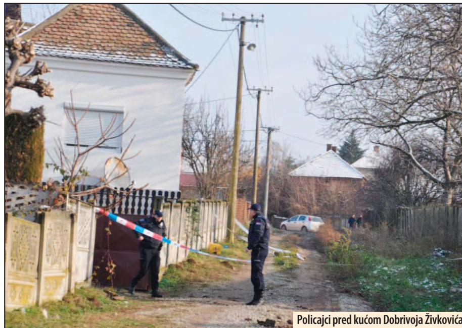
Policajci pred kućom Dobrivoje Živkovića

Požarevac - U požarevačkoj bolnici još uvek se radi obdukcija tela policajca Srđana Petrovića (42) i njegovog ubice Dobrivoje Živkovića (69) iz sela Bare, koji je likvidiran od strane specijalaca. Tek posle obdukcije znače se tačan uzrok smrti obojice stradalih. Istraga se vrši kako bi se utvrdile sve okolnosti njihovog stradanja, ali i zbog toga da se uvidi da li je bilo propusta u ovoj akciji. Kako