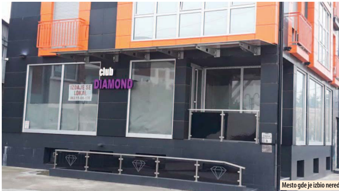
Mesto gde je izbio nered