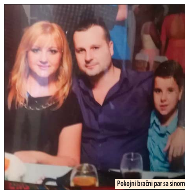
Pokojni bračni par sa sinom

pa ga je snaja prijavila policiji. Posle su išli u Centar za socijalni rad, ali se i pomirili. Međutim, opet je izbila neka svađa među njima. On nam je tada javio da ona hoće da se razvede