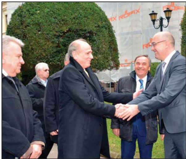
Ministar bez portfelja Milan Krkobabić u Požarevcu