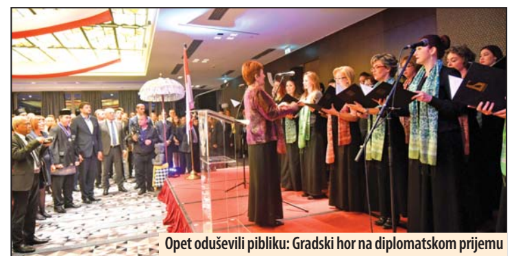
Opet oduševili publiku: Gradski hor na diplomatskom prijemu

Saradnja Indonezije i Hora „Barili“ prerasla u lepu tradiciju