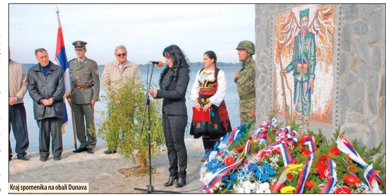
Kraj spomenika na obali Dunava