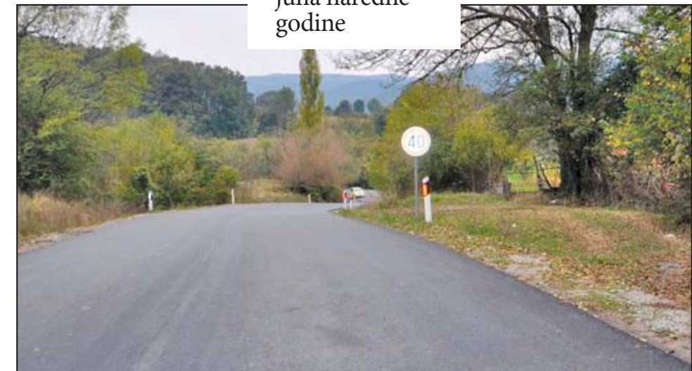
Nastavak radova na proleće: Asfaltirana deonica

istoimenog manastira. On je tada naglasio da je dobra saobraćajna infrastruktura jedan od glavnih uslova za dovođenje investitora u taj kraj, kao i da će se nakon obnove turisti iz Srbije i inostranstva lakše uputiti u ove nezagadene i prelepe krajeve. M. Veljković