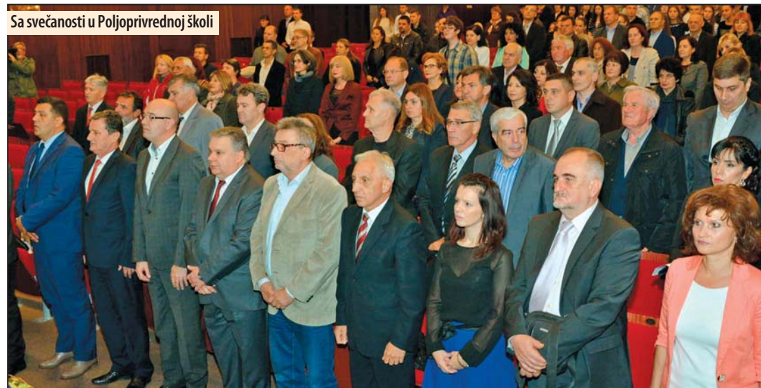
Sa svečanosti u Poljoprivrednoj školi

- Naznačiću i 1996. godinu kada je otvoren Dom učenika. Taj podatak ponovo govori o tome da se vaši prethodnici u upravi nisu zadovoljavali postojećim stanjem, već su ga stalno unapređivali. Danas, gledajući vas i vaše rezultate sa sigurnošću mogu reći da na čelu škole imaju dostojne naslednike. Dame i gospodo, čestitam vam jubilej, 144 godine postojanja, rada i uspeha u školovanju mladih stručnjaka, rekao je još gradonačelnik. Z. V.