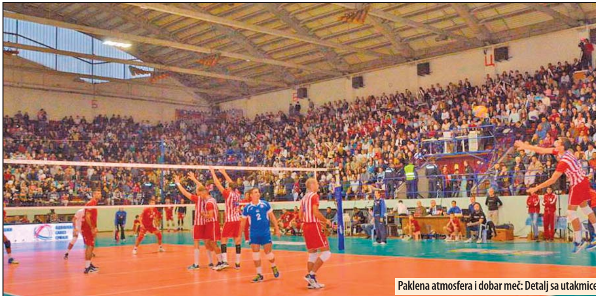
Paklena atmosfera i dobar meč: Detalj sa utakmice

U izvanrednoj, sportskoj atmosferi prepune dvorane u Požarevcu, Zvezda je posle pet setova stigla do petog pehara. Posle dominantne igre u prvom setu, popustila je u finišu drugog, što je domaćin iskoristio i izjednačio na 1:1. U trećem setu, Zvezda je ponovo rano stekla veliku prednost, koju je uspešno sačuvala za novo vodstvo. Poče-