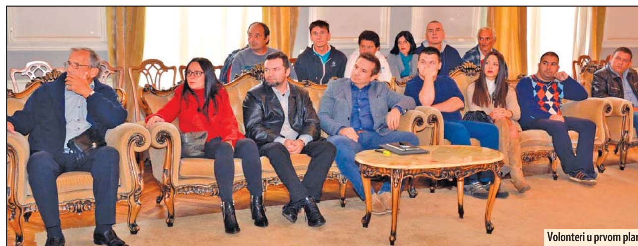
Volonteri u prvom planu

- Znate i sami da smo imali problema da goste grada ubedimo da dekoraciju ne čine neki skupoceni kristali, već delovi plastičnih flaša. To je druga korist vašeg volontiranja. I na kraju treća, po mom mišljenju, podjednako važna korist volontiranja jeste upravo to što ste imali priliku da