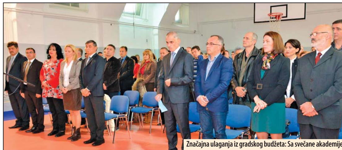
Značajna ulaganja iz gradskog budžeta: Sa svečane akademije

vođenje nastave fizičkog vaspitanja. Svi radovi su realizovani sredstvima iz budžeta grada Požarevca u ukupnoj vrednosti od 3.000.000 dinara, istakao je Radovanović. Osim projekta renoviranja sale, iz budžeta grada je obezbeđeno 740.000 dinara, za ugradnju postrojenja za podizanje pritiska u protivpožarnom hidrantskom sistemu zgrade i realizacija tog projekta je u toku.