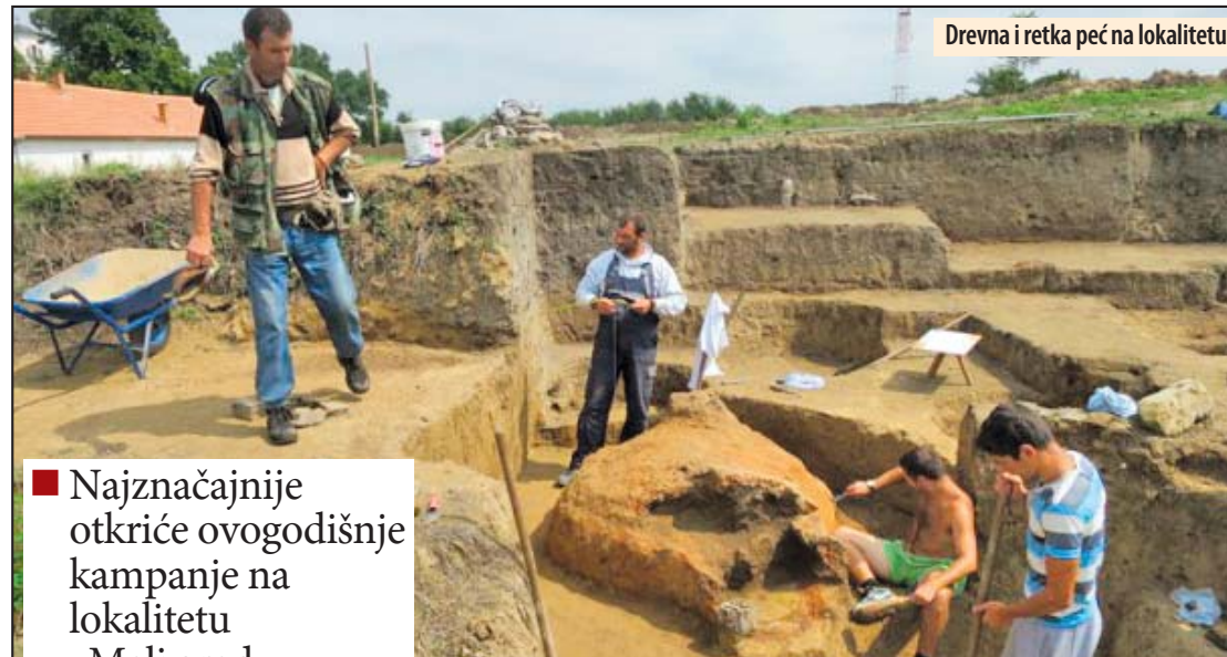
Drevna i retka peć na lokalitetu

Najznačajnije otkriće ovogodišnje kampanje na lokalitetu „Mali grad - Todića crkva“