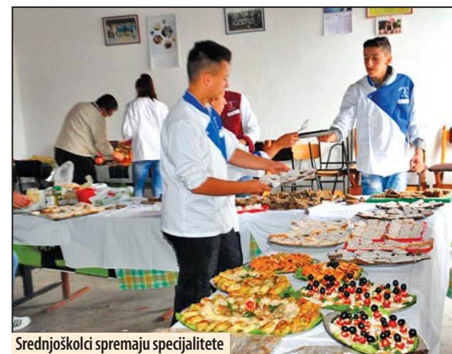
Srednjoškolski spremaju specijalitete

žbe, kojoj su prisustvovali članici opštine Žagubica, članovi Ekološkog društva Srbije, posetoci iz cele Srbije i domaćini, gosti su mogli da uživaju u degustaciji najfinijih specijaliteta spravljanih od gljiva. U pratećem programu jedanaestih „Dana gljiva i bilja“