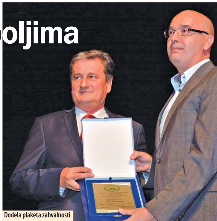
Dodela plaketa zahvalnosti

- Jedan mudar potez tadašnjih ljudi, koji su vodili grad i školu, uz nesebičnu pomoć države i ministarstva, stvorili su priliku da imamo ovakav jedan jubilej.