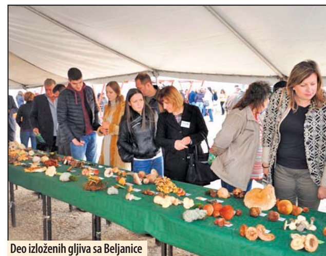
Deo izloženih gljiva sa Beljanice

Sakupljači su u subotu tragali za gljivama i biljkama, a u nedelju su izložili više od 100 vrsta gljiva i na desetine vrsta raznog bilja. Sakupljači su ih po obroncima Beljanice, u krugu od oko 10 kilometara. Posle otvaranja izlo-