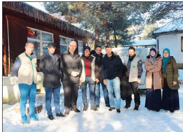
Pomoć izbeglicama u Tutinu i Beogradu