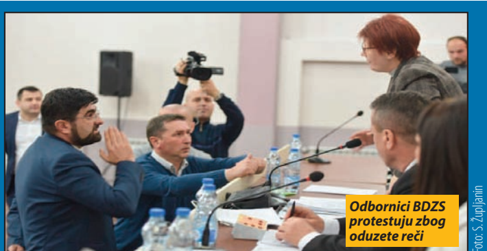
Odbornici BDZS protestuju zbog oduzete reči

- Za nas je izuzetno važna transparentnost u radu i saradnja s građanima. Napredovali smo na listi transparentnih gradova i težićemo da se što više otvaramo prema građanima, jer nam je to najbitnije. Želja nam je da građani imaju puno poverenje u naš rad, da aktivno učestvuju u razvoju grada, da nam daju sugestije, predloge, pokreću inicijative. Naše je opredeljenje da budemo otvoreni i da zajedno stvaramo bolje uslove za život i rad u gradu.