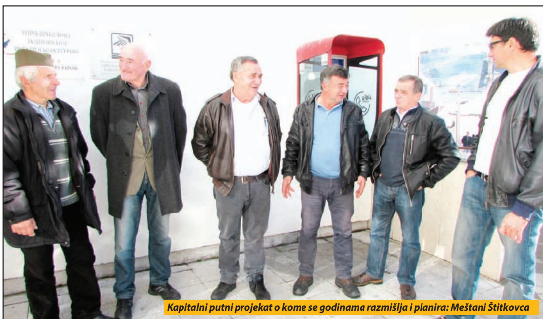
Kapitalni putni projekat o kome se godinama razmišlja i planira: Meštani Šitkovca

Na sastanku se čulo da su se, inače, komšije o realizaciji ovog kapitalnog posla dogovarale pre šest godina. Formiran je zajednički odbor, snimljena je trasa, a beogradska firma „Borisavljević“ uradi-