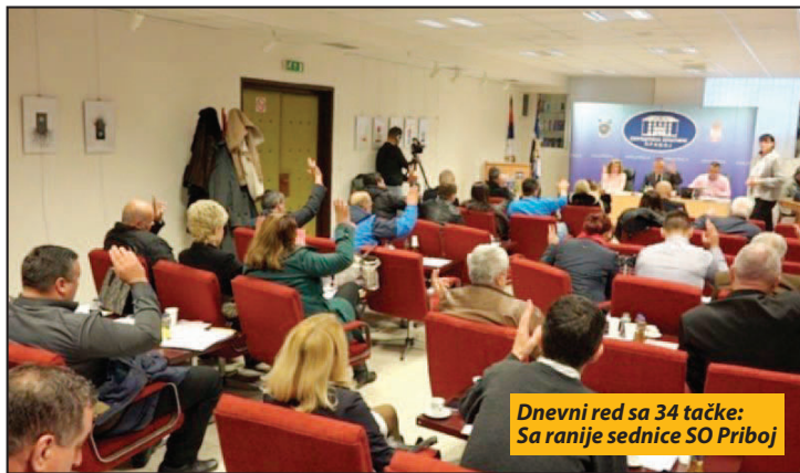
Dnevni red sa 34 tačke: Sa ranije sednice SO Priboj

- Sportska infrastruktura je u lošem stanju pa su tu ulaganja neminovna, isti je slučaj sa poboljšanjem i popravkom saobraćajne infrastrukture. Veliki deo budžeta izdvojen je na investicije, oko 22 odsto, rekao je Rvović i dodao da su u 2018. godini predviđena i značajna sredstva za stručnu praksu, za osposobljavanje za rad u Fabrici automobila Priboj.