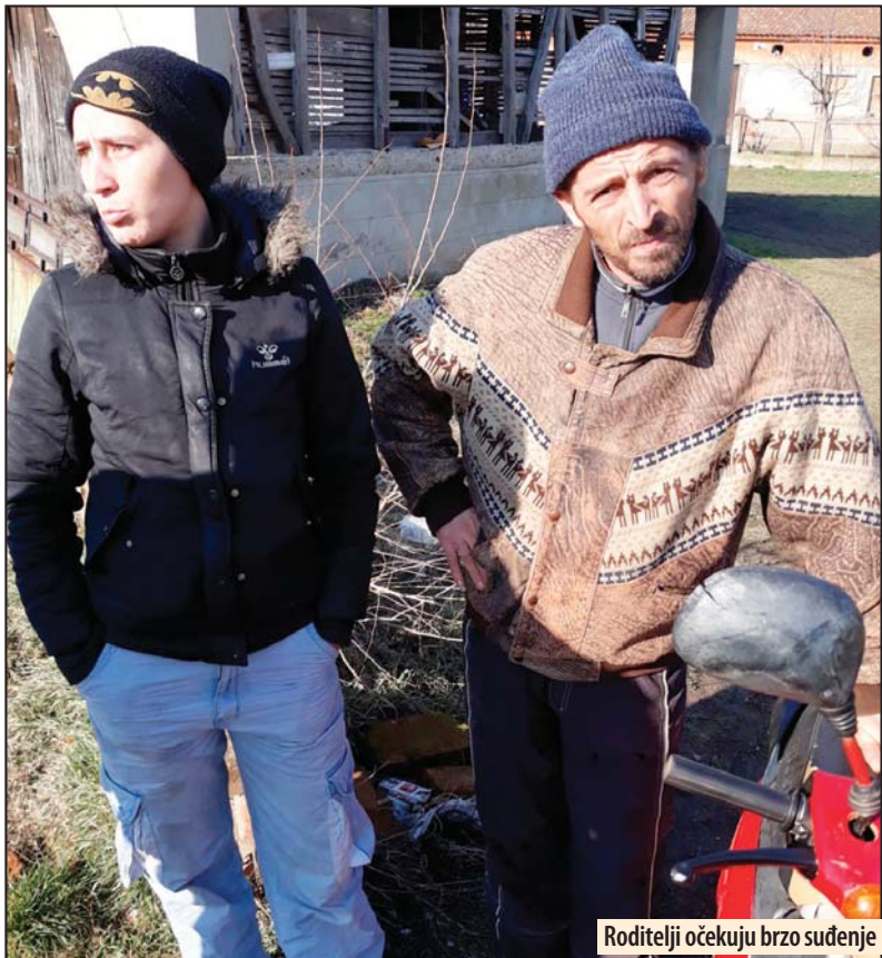
Roditelji očekuju brzo suđenje

ve u Italiji. On u skromnoj kući živi sa, pored nevenčane supruge i dvoje deca, majkom Jelenom (58) koja još ne može da se povрати od šoka koji je zadesio njenu porodicu.