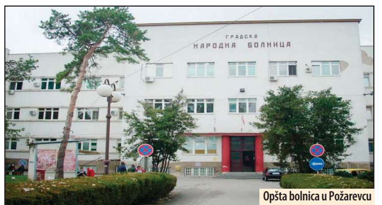
Opšta bolnica u Požarevcu

On je tokom nekoliko dana, koliko je protestovao, bio pod budnim okom lekara i obezbeđenja, naročito zbog toga jer je 2013. godine pretio samoubistvom. On se tada popeo na krov bolničke zgrade i pretio da će da skoči, ali ga je policija od toga odvratila. Razlog ovog njegovog čina bilo je to što je mislio da mu godišnji odmor nije odobren, jer je, navodno, dobio otkaz. Međutim, ispostavilo se da nije pravilno podneo zahtev za odmor, koji mu je ubrzo odobren. M. V.