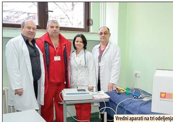
Vredni aparati na tri odeljenja

okruža, pre svega na Prijemnom odeljenju, Internom odeljenju i Porodilištu. Naime, pored CTG dijagnostičkog uređaja za Porodilište, nabavljena su i dva EKG dijagnostička uređaja za Prijemno i Interno odeljenje.