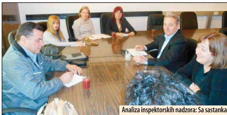
Analiza inspektorskih nadzora: Sa sastanka

Tema skupa bila je analiza redovnih inspektorskih nadzora u školskoj 2017/18. godini i rešavanje nejasnoća u radu. Učesnici su tokom sastanka ukazali na probleme i sporna pitanja sa kojima se susreću prilikom nadzora na koja su dobili konkretne odgovore predstavnika Ministarstva prosvete. Takođe, razmena