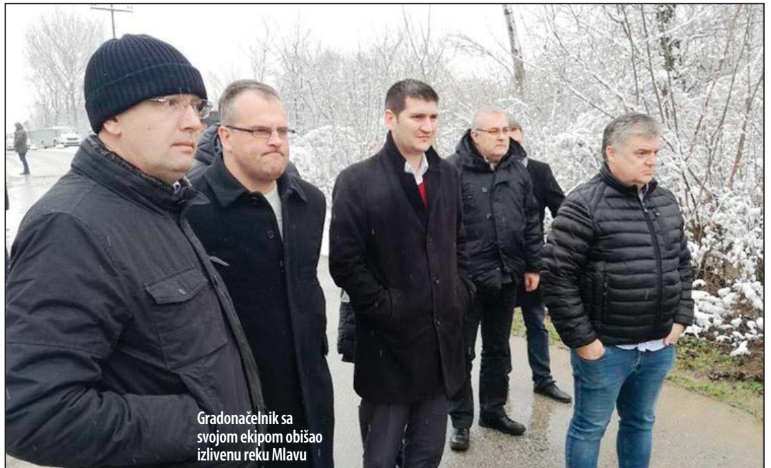
Gradonačelnik sa svojom ekipom obišao izlivenu reku Mlavu

Požarevac za sanaciju korita reke Mlave izdvaja 60 miliona dinara