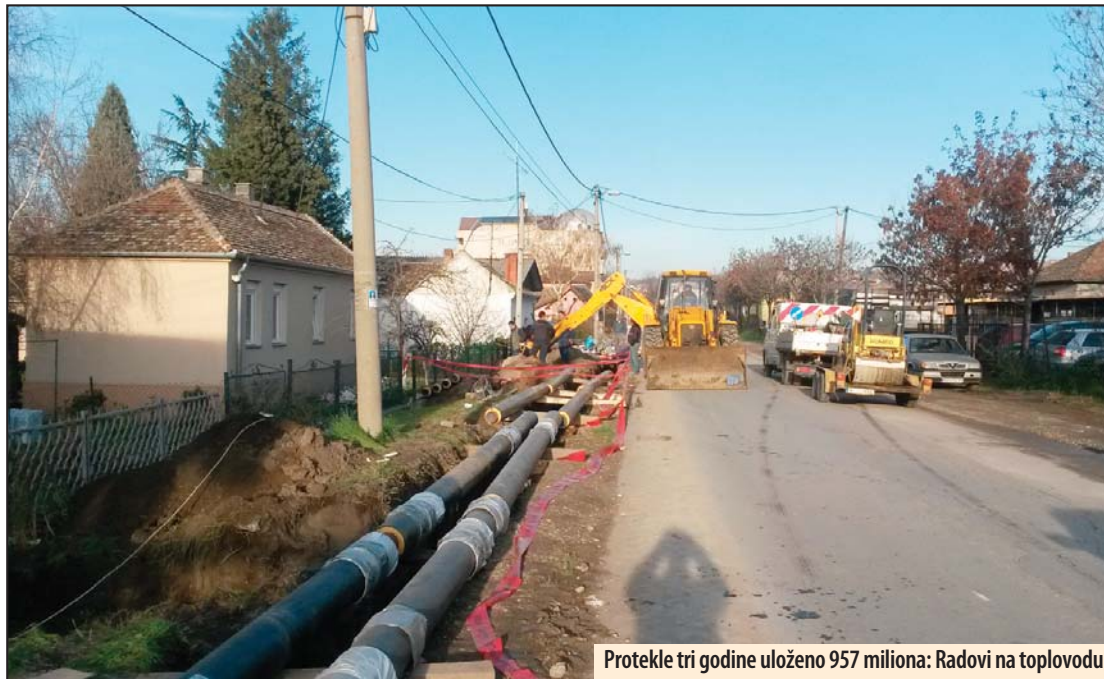
Protekle tri godine uloženo 957 miliona: Radovi na toplovodu

Takođe, u ovoj Mesnoj zajednici u planu je i izgradnja toplifikacionog sistema radi izgradnje priključnog vrelovoda i jedne TPS OŠ Sveti Sava koja bi u narednom periodu omogućila distributivnu mrežu u zoni ulica Vojske Jugoslavije, Nemanje Tomića, Bože Dimitrijevića, Ivana Gorana Kovačića, Jelene Četković i Skojevske u Požarevcu vrednosti 18.000.000 dinara. Kapitalne investicije za ovu godinu planirane su i za MZ „Bulevar“ i to nastavak toplovoda kroz Izvorsku ulicu, vrednosti 7.000.000 dinara kao i u MZ „Ča-