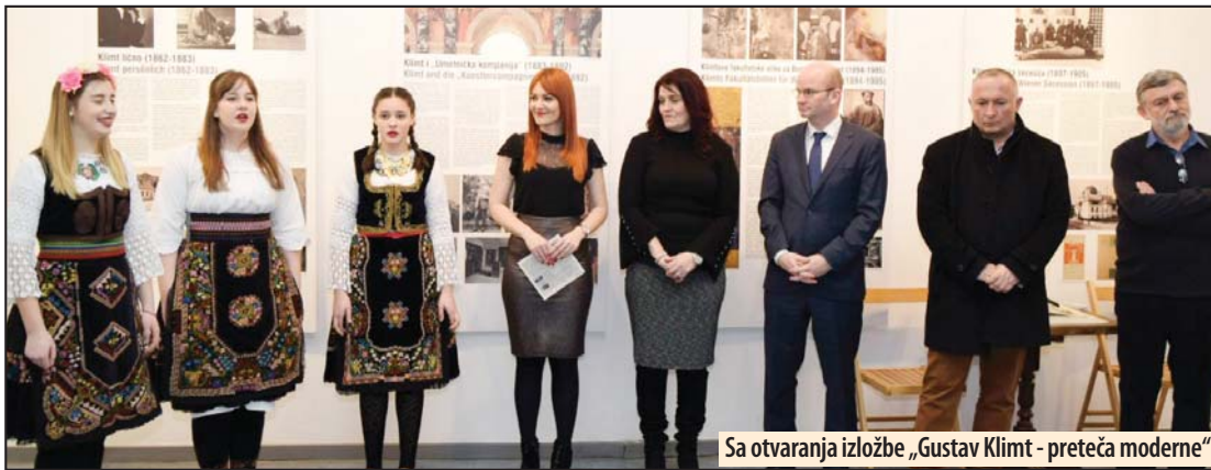
Sa otvaranja izložbe „Gustav Klimt - preteča moderne“

„Gulini dani“ i izložba uz posetu predstavnika Austrijskog kulturnog foruma