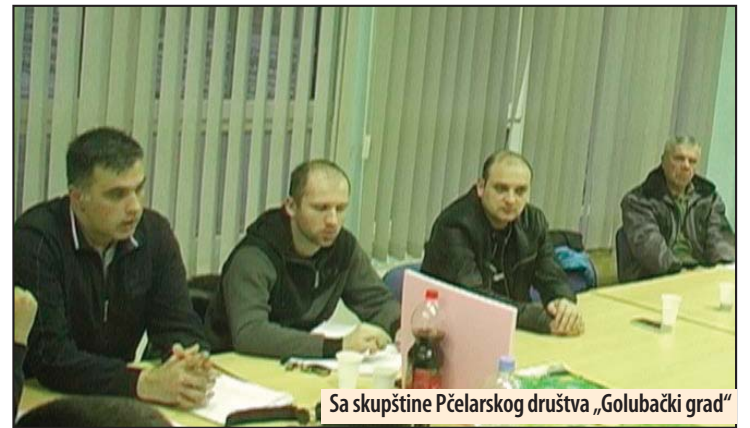
Sa skupštine Pčelarskog društva „Golubački grad“

Golubački pčelari dobili svoj zaštitni znak sa geografskim poreklom