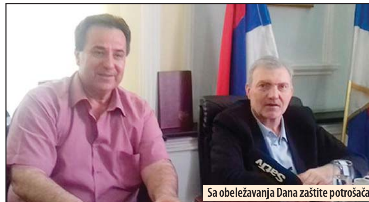
Sa obeležavanja Dana zaštite potrošača

Požarevac - Svetski dan zaštite prava potrošača obeležen je u Požarevcu pošto je Ministarstvo trgovine, turizma i telekomunikacija zadužilo Odeljenje tržišne inspekcije u ovom gradu da bude nosilac obeležavanja tog veoma važnog datuma. Inače, sektor tržišne inspekcije u Požarevcu pokriva Braničevski i Podunavski okrug.