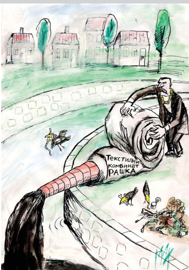
Ilustracija: M. Đerlek