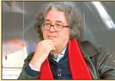
Piše: Mehmed Slezović

U nedavnom intervjuu Danasu (7 - 8 april 2018), istoričar i bivši diplomata, Milan St. Protić je jasno i glasno izneo imperativ da „Srbija mora da se odluči kojoj civilizaciji pripada“. Iako na prvi pogled izgleda da dileme nema, jer Srbija zvanično teži evropskim integracijama i pri tom otvara poglavlja na svom evropskom putu, ovo pitanje zaslužuje dublju pažnju koja se ne mora sagledavati samo u svetlu aktuelne politike koja podrazumeva sedenje na dve stolice (i EU i Rusija) ili i dalje prisutne i EU i Kosovo.