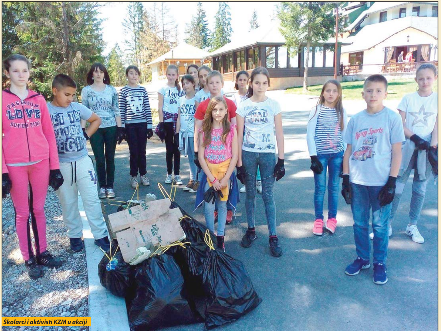
Školari i aktivisti KZM u akciji

Dan planete Zemlje obeležen u Novoj Varoši