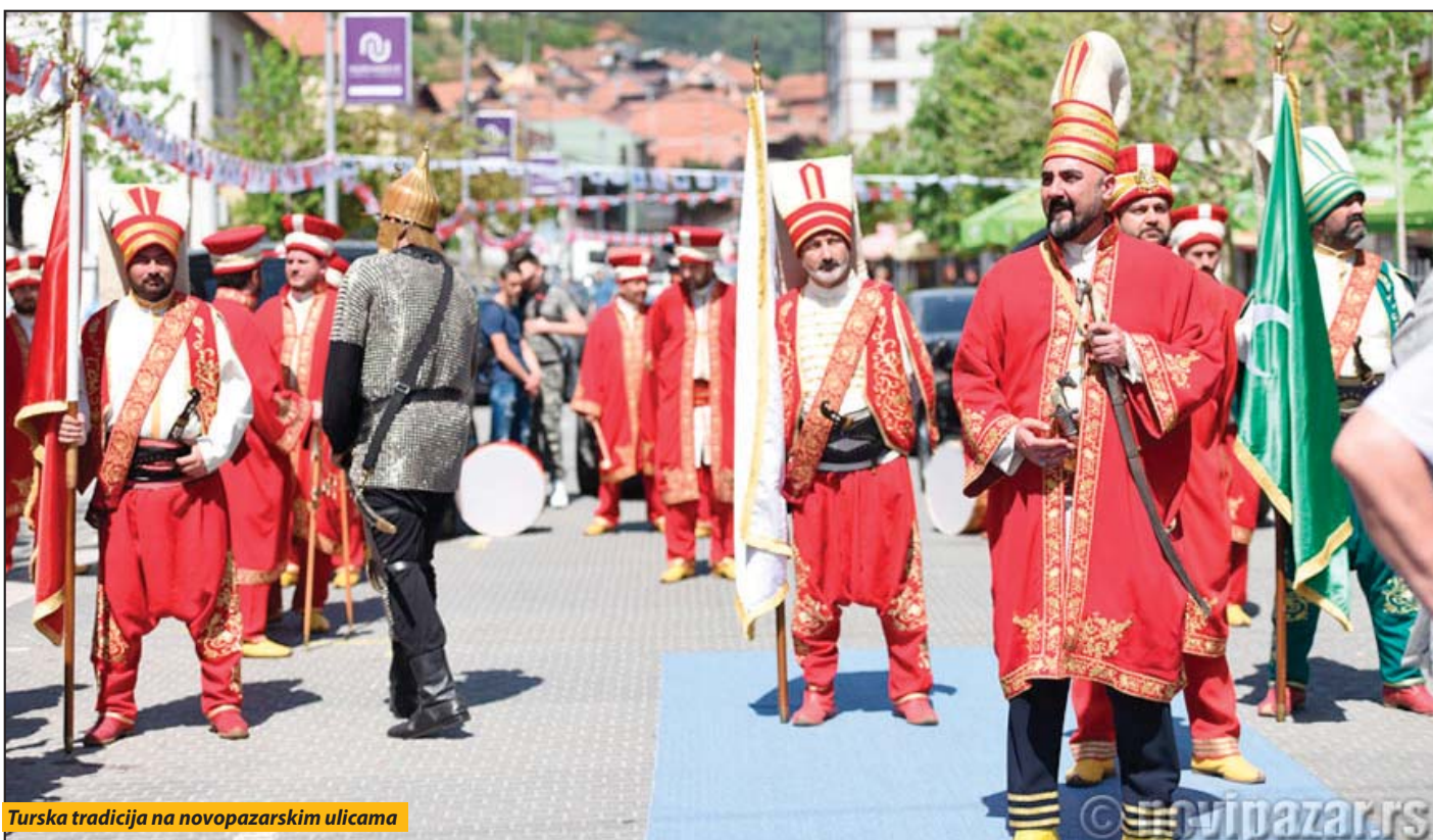
Turska tradicija na novopazarskim ulicama

Berane dobilo novo-starog predsednika i budžet za 2018.