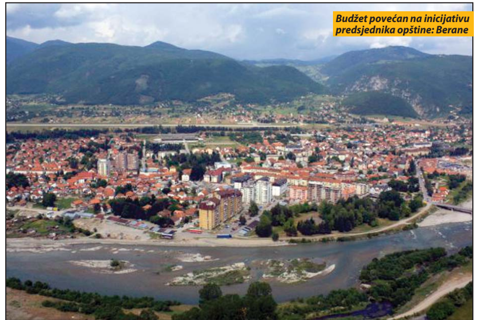
Budžet povećan na inicijativu predsjednika opštine: Berane