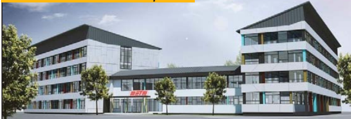
Nova kotlarnica na biomasu u sklopu škole