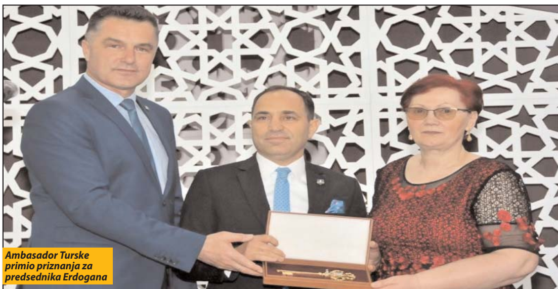
Ambasador Turske primio priznanja za predsednika Erdogana