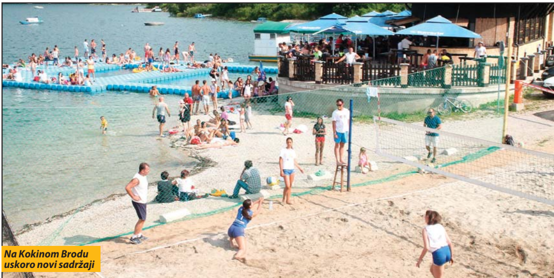
Na Kokinom Brodu uskoro novi sadržaji

Nova Varoš - Na obali Zlatarskog jezera u Kokinom Brodu uskoro će početi gradnja akva-parka. Moderni kompleks na vodi, jedinstven na prostoru Balkana, biće pušten u funkciju ovog leta, a sredstva za njegovu izgradnju, od 4,6 miliona dinara, obezbedili su Ministarstva turizma i Opština Nova Varoš.