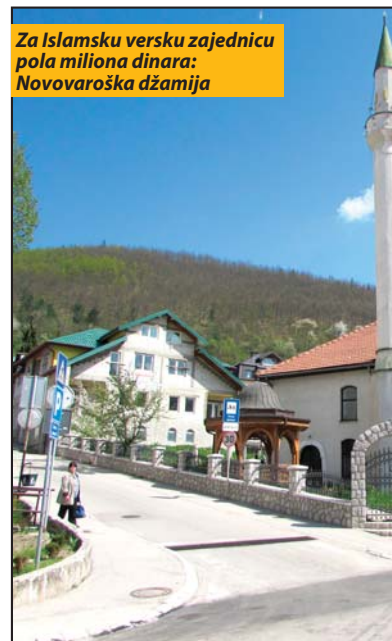
Za Islamsku versku zajednicu pola miliona dinara: Novovaroška džamija

Opština će sa 950.000 dinara podržati izgradnju kapele na gradskom groblju Kocelj i uređenje trotoara oko Parohijskog doma u porti hrama „Svete Trojice“ u Novoj Varoši. Za realizaciju projekta izgradnje gorionika za paljenje sveća, crkva u Negbini će iz gradske kase biti podržana sa 100.000 dinara, koliko će dobiti i bogomolja u Radijevićima za izgradnju pristupne staze na ulasku u hram, manastir „Svetog Joakima i Ane“ u Janji kod Rutoša za treću etapu projekta izgradnje monaške kuće, kao i hram „Svetog preobraženja Gospodnjeg“ u Beloj Reci, objektu čija je rekonstrukcija neophodna do kraja ove godine. Iz opštinskog budžeta će sredstvima od 150.000 dinara biti finansirani i radovi na adap-