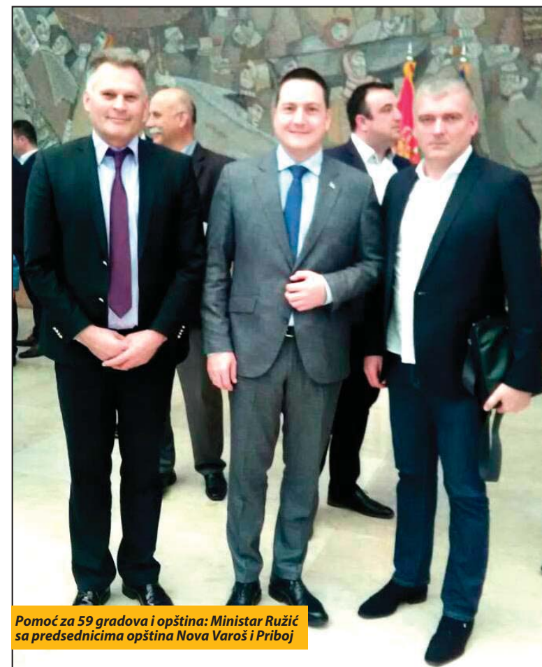
Pomoć za 59 gradova i opština: Ministar Ružić sa predsednicima opština Nova Varoš i Priboj

sivanja ugovora sa gradonačelnicima i predsednicima opština koje su dobile sredstva iz Republike. On je ocenio da je cilj ovog programa da se lokalnim samoupravama pomogne u po-