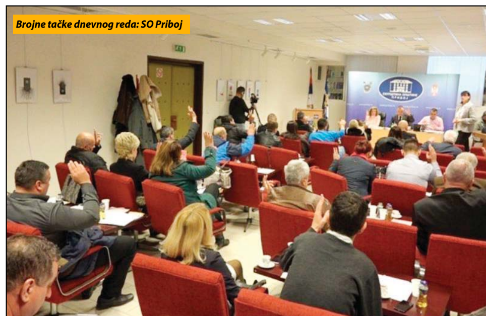
Brojne tačke dnevnog reda: SO Priboj

vezane za verifikovanje promena u sastavu obrazovnih ustanova opštine Priboj. S. B.