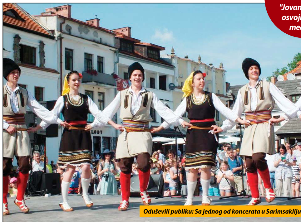
Oduševili publiku: Sa jednog od koncerata u Sarimsakliju

Na Međunarodnom festivalu folklor, KUD Doma kulture "Jovan Tomić" osvojio četiri medalje