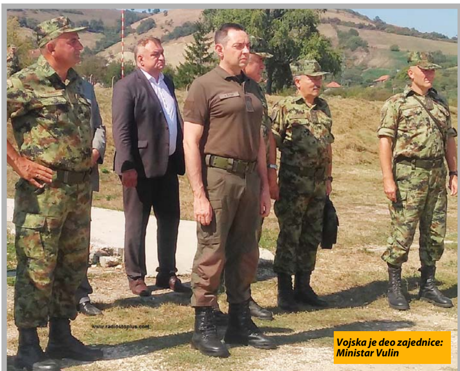
Vojska je deo zajednice: Ministar Vulin

Ministar odbrane Aleksandar Vulin obišao vojnike u Novom Pazaru