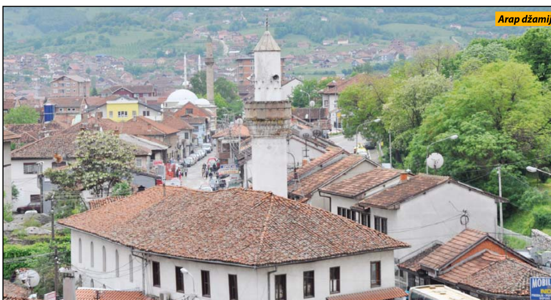
Arap džamija - nekada i sada

Novi Pazar - Od pre tri dana, od najstarijeg građevinskog i verskog objekta - Arap džamije, u Novom Pazaru ostao je samo minaret. Ona je na po-