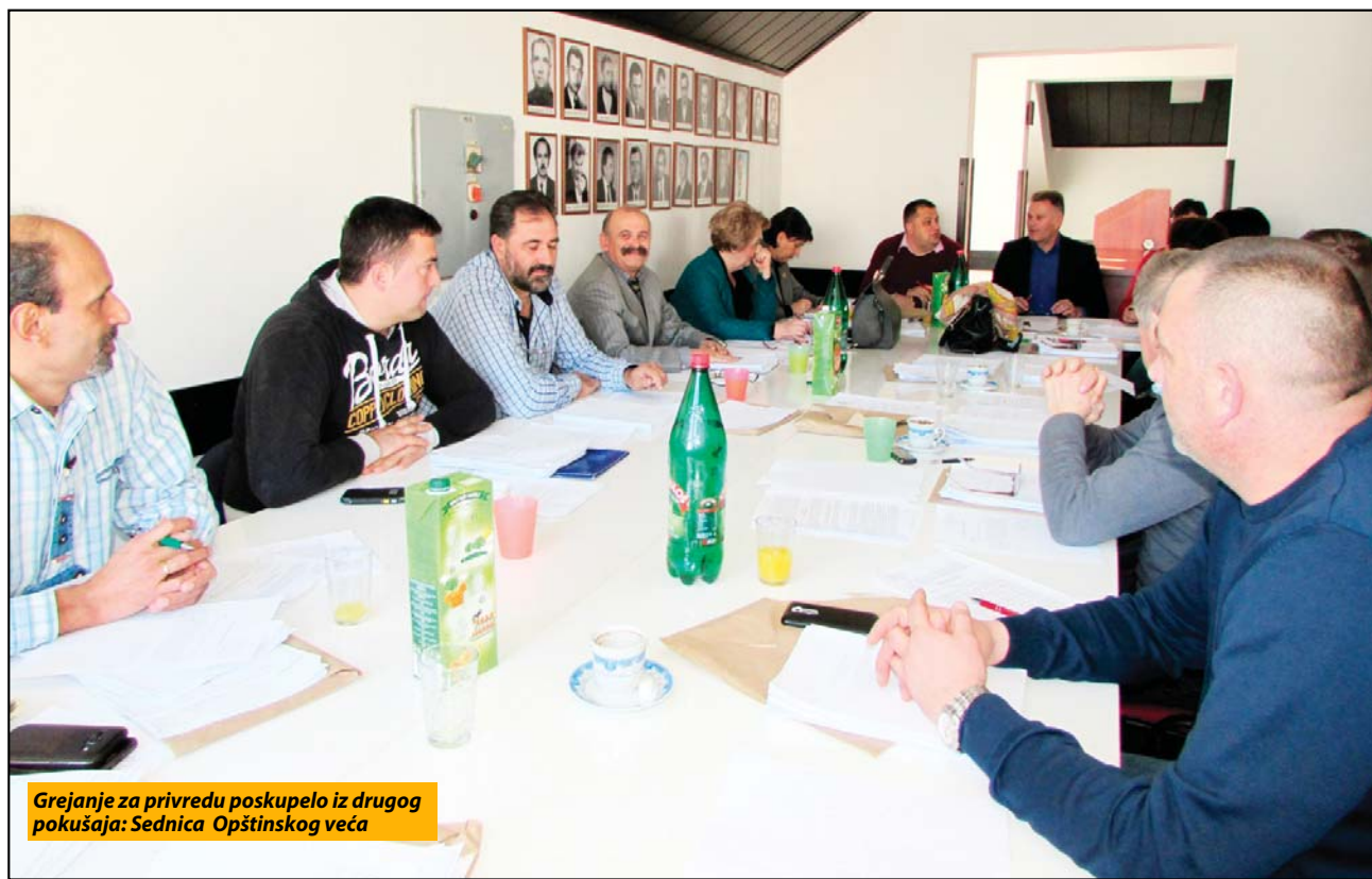
Grejanje za privredu poskupelo iz drugog pokušaja: Sednica Opštinskog veća

nesena kako na kraju direktno ne bi ispaštali građani. Najveći teret novog cenovnika podneće, međutim, lokalna samouprava, koja će za zagrevanje površina u vla-