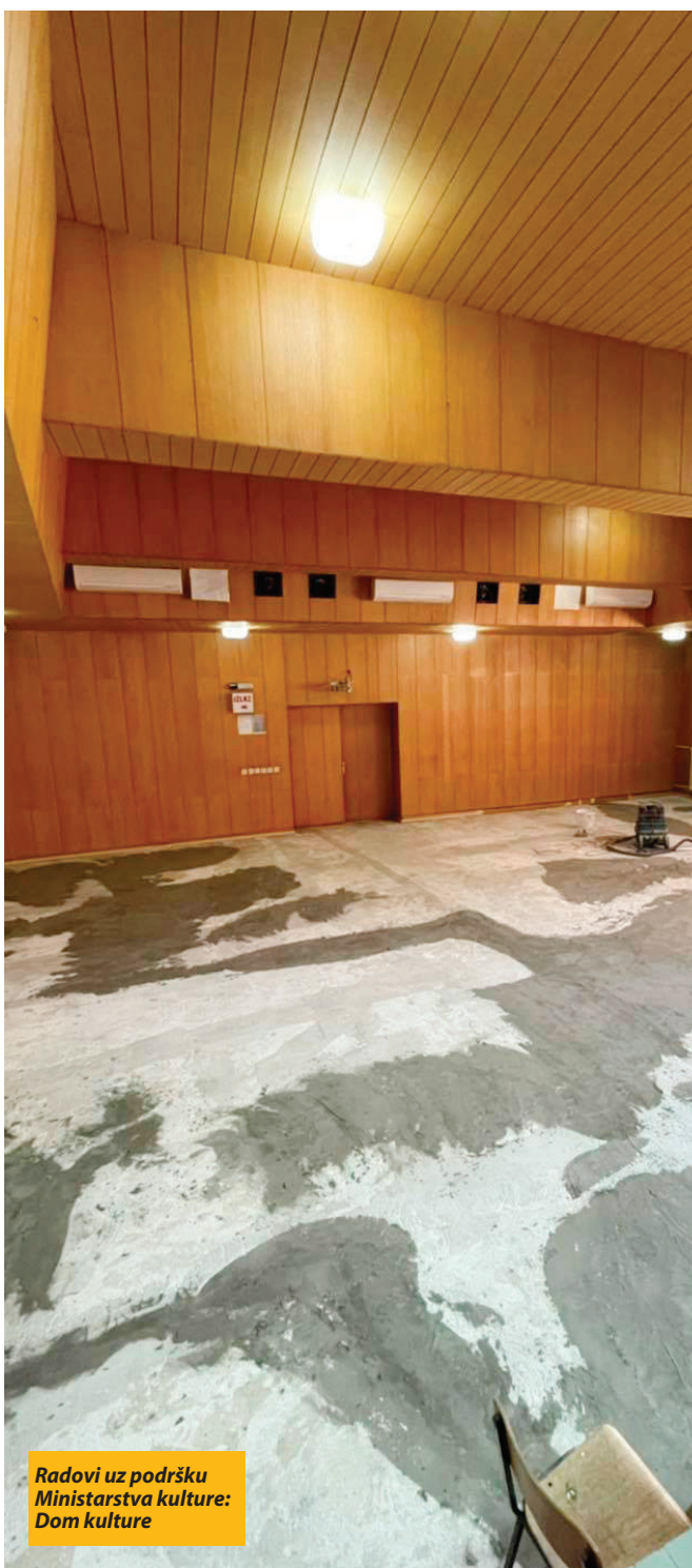
Radovi uz podršku Ministarstva kulture: Dom kulture