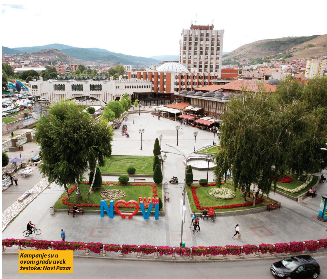
Kampanje su u ovom gradu uvek žestoke: Novi Pazar